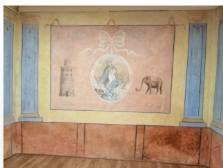
Sala de Pinturas