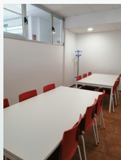
Sala Trabajos en Grupo