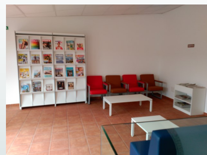
Zona de Prensa