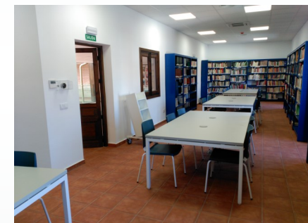
Sala de Estudio