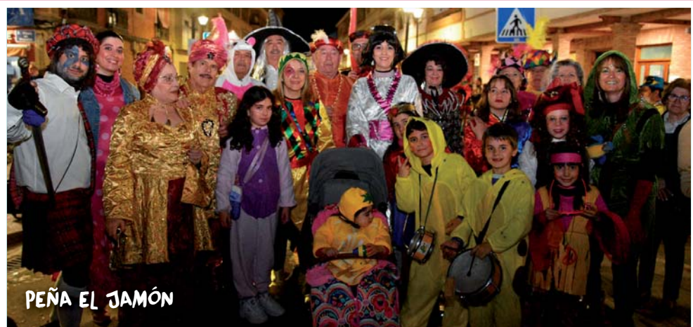
PEÑA EL JAMÓN