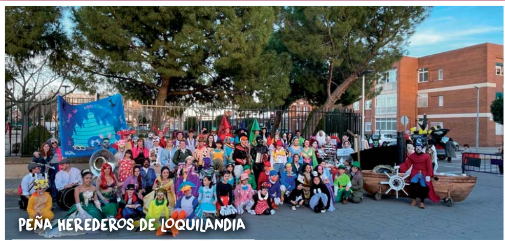
PEÑA HEREDEROS DE LOQUILANDIA