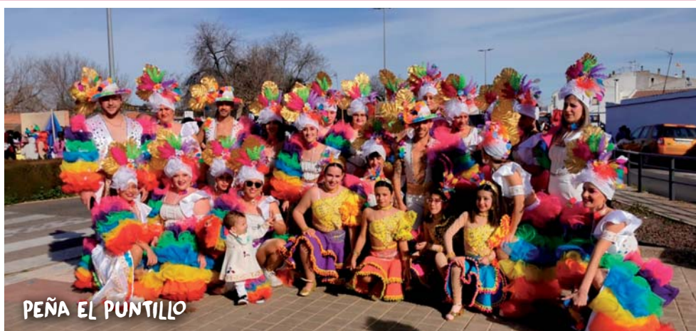
PEÑA EL PUNTILLO