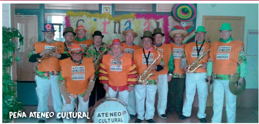
PEÑA ATENEO CULTURAL