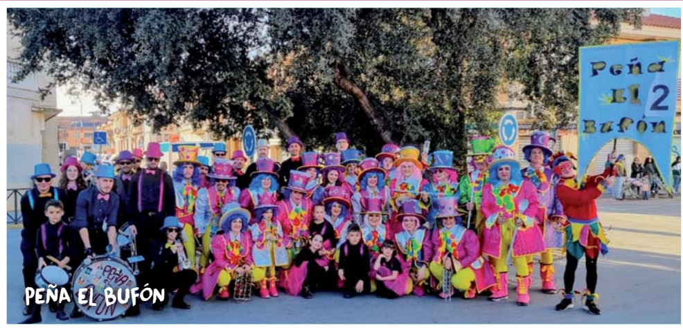
PEÑA EL BUFÓN