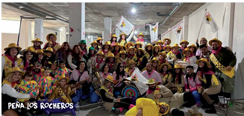
PEÑA LOS ROCHEROS