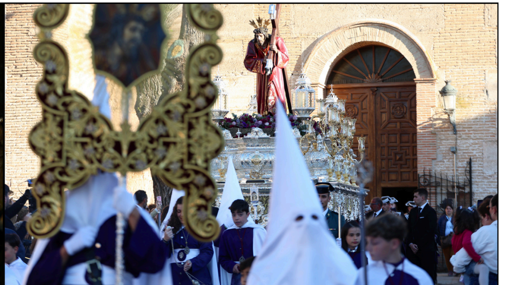
Jueves Santo, salida de Nuestro Padre Jesús Nazareno de la ermita de la Estrella