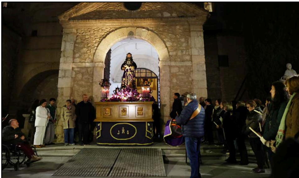
Miércoles Santos, imagen Jesús Nazareno de Medinaceli

Con la procesión del Domingo de Resurrección la Asociación de Hermandades de Semana Santa culmina su semana grande, destacando no solo la impecable organización de los traslados e itinerarios, sino también la afluencia de público, que confirma a la Semana Santa de Miguelturra como una de las citas religiosas y culturales más tradicionales de la región, enmarcada dentro de la Ruta de la Pasión Calatrava, Fiesta de Interés Turístico Nacional.