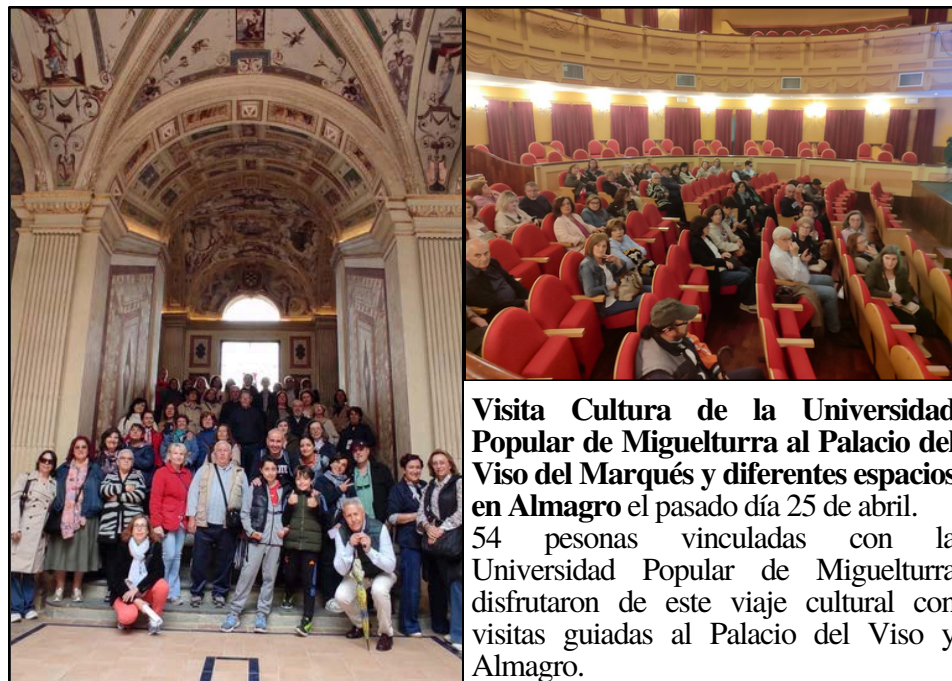
Visita Cultural de la Universidad Popular de Miguelturra al Palacio del Viso del Marqués y diferentes espacios en Almagro el pasado día 25 de abril.

54 personas vinculadas con la Universidad Popular de Miguelturra disfrutaron de este viaje cultural con visitas guiadas al Palacio del Viso y Almagro.