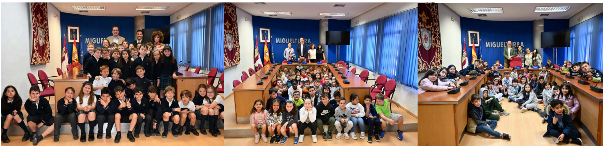
Visita Colegio El Cristo