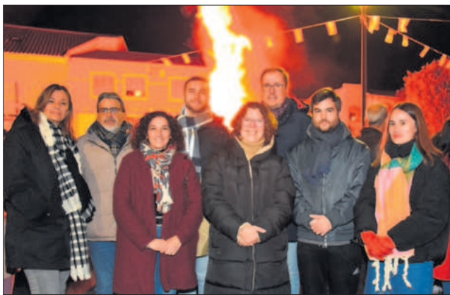
El Alcalde, acompañado por concejales y concejales del ayuntamiento

todas las personas asistentes, que abandonaron progresivamente el lugar a medida que la hoguera iba llegando a su fin y que al día siguiente volvieron a las puertas de la ermita para bendecir a sus mascotas.