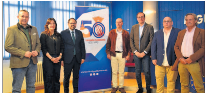
Autoridades y directivos del CD Miguelturneño en la presentación de los actos conmemorativos

En otro orden de cosas, el alcalde ha querido realzar y recordar "la importancia del deporte para este Equipo de Gobierno, donde las subvenciones deportivas a los clubes locales han pasado de 70.000 a 110.000 euros, 40.000 euros más en dos años. Muestra de ese compromiso que tenemos con