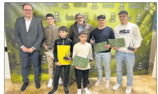
El alcalde y el concejal de Deportes junto a los galardonados locales