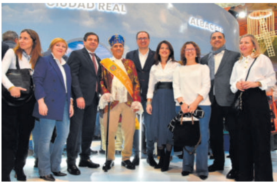
Autoridades junto al Rey del Carnaval en su visita a FIUR