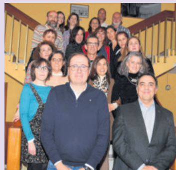
El Alcalde y el concejal de Personal, junto al personal que han consolidado sus plazas

El alcalde y el concejal de Personal, junto al personal que han consolidado sus plazas