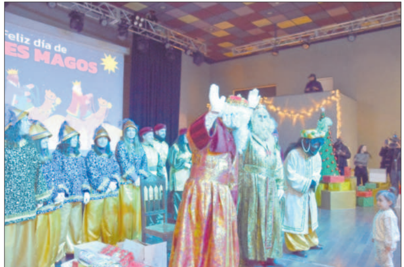
Sus Majestades, los Reye4s Magos de Oriente, saludaron a los niños y niñas en el CERE

Hay que recordar que los niños y niñas de Miguelturra ya estaban avisados de que esta Cabalgata iba a ser espectacular, ya que el Heraldo Real visitaba la localidad re-