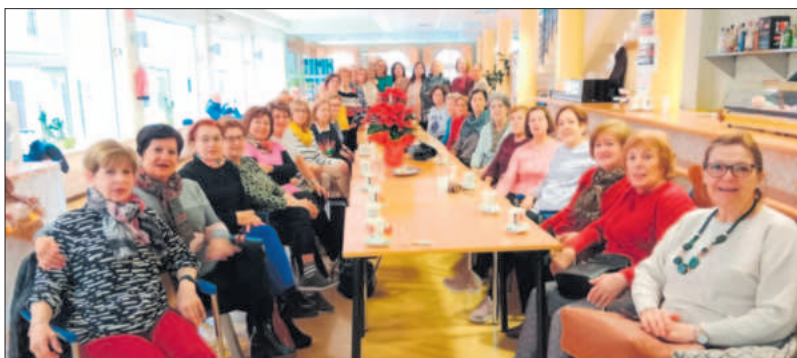
Las participantes en el curso durante el acto de clausura

El Centro de Día clausuró un 'Taller de Pranayama y Relajación' que se ha venido celebrado durante todo el año, a excepción de los meses de verano.