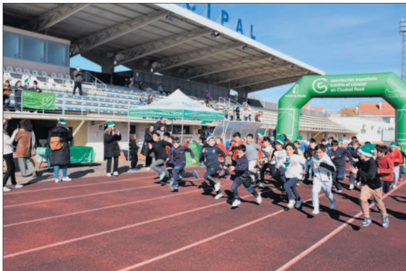
Niñas y niños durante la actividad celebrada en el estadio municipal

Vinuesa resaltaba que el Consejo Municipal de Salud "solo puede seguir colaborando y apoyando este tipo de iniciativas que