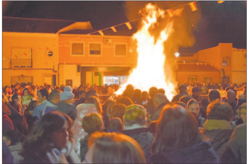
En la tradicional hoguera, junto a la ermita, se dieron cita multitud de personas