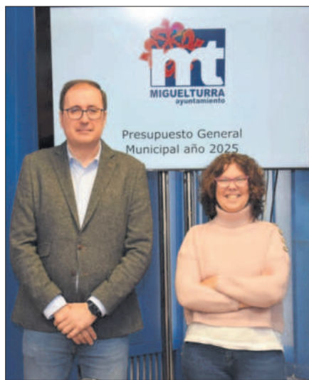
El Alcalde y la concejala de Hacienda

El Área de Nuevas Tecnologías sube un 5,47%, principalmente por aumento en las partidas de las licencias de los programas informáticos. Área de Comunicación también aumenta su presupuesto, por