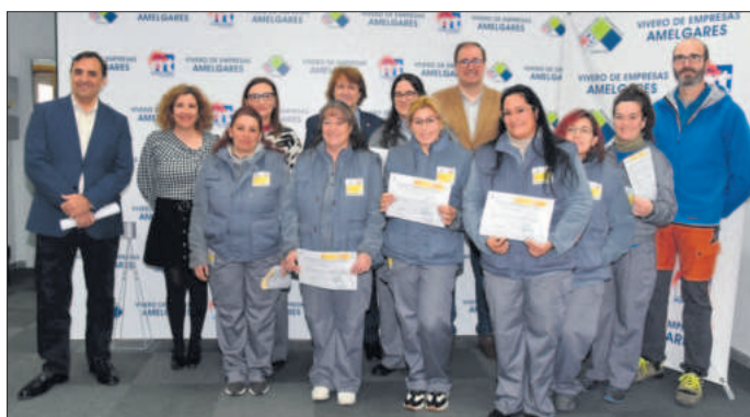
Autoridades locales y regionales junto al alumnado que ha terminado este ciclo formativo