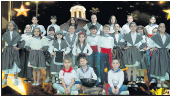
Niñas y niños integrantes del coro del colegio El Pradillo