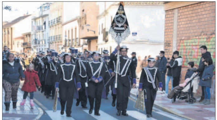
La Agrupación Musical "Cristo de la Piedad" fue la encargada de acompañar al Santo en su procesión

Al día siguiente, se bendecían a los animales en la puerta de la ermita demostrando el amor por los animales en la localidad. A continuación, se celebró la tradicional procesión con la imagen de San Antón, que recorrió distintas calles del municipio.