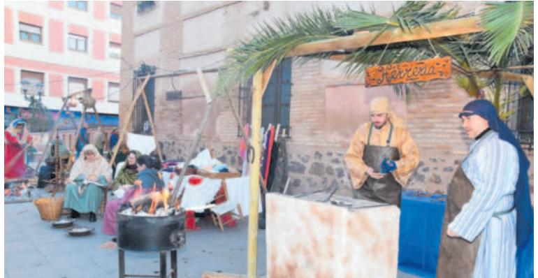
La Hermandad del Cristo de la Piedad se supera cada año para ofrecer un gran espectáculo navideño