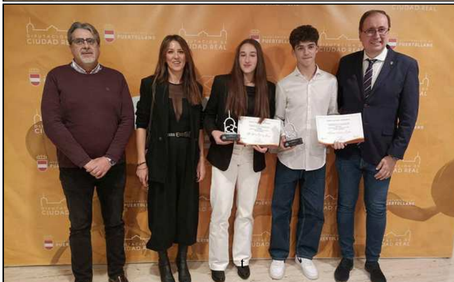
Imágenes de la Gala Provincial de Deportes, con el Alcalde de Miguelturra, el concejal de Deportes, trabajadores del Área de Deportes, premiados y responsables de los Club reconocidos.

Mohíno destacó la importancia fundamental del convenio con ACEDEN (Asociación de Clubes y Escuelas Deportivas de Miguelturra), gracias al cual cientos de niños y niñas disfrutaban de la práctica deportiva en la localidad.