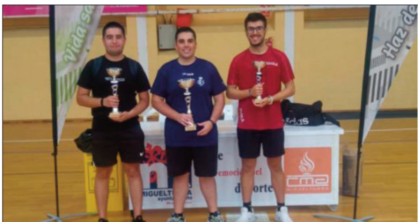
Trofeo senior de Tenis de Mesa