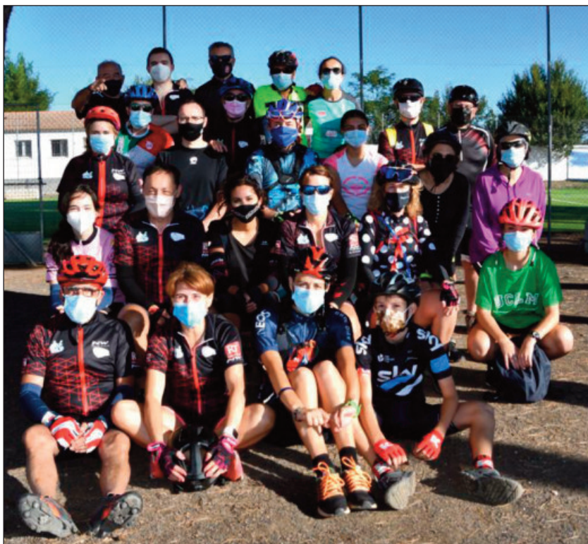
Ruta familiar de Montain Bike