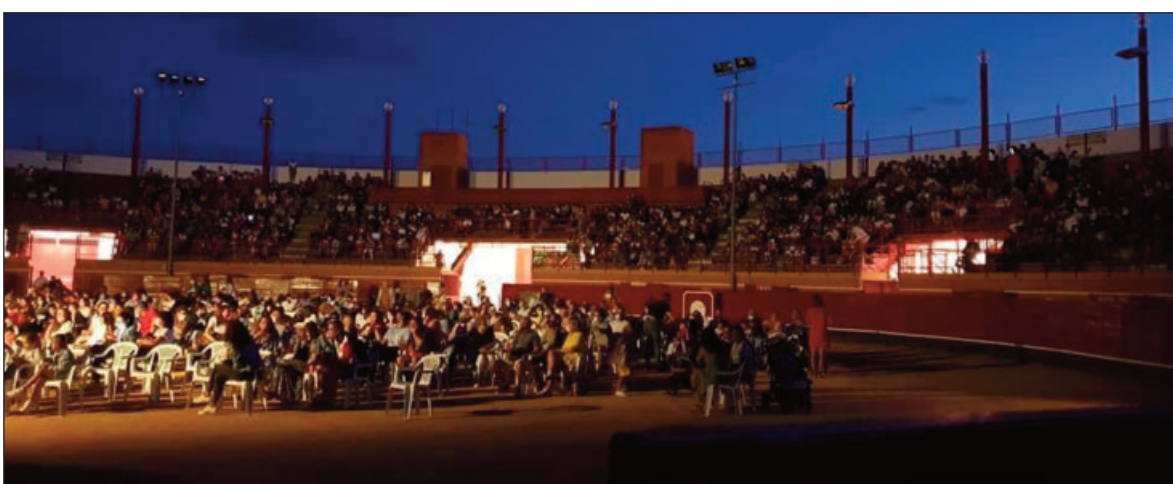
El espectáculo infantil "El Rey León" fue el acto con mayor número de público