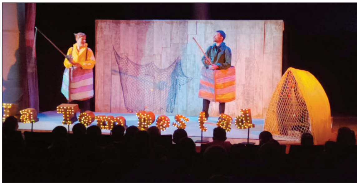
El grupo de Puertollano, "300 Alas Blancas" hizo las delicias del alumnado de 2º y 3º de Primaria

Ha vuelto el teatro escolar a Miguelturra con el espectáculo "La tempestad" de la compañía '300 Alas Blancas'. Así, ciento cincuenta escolares, de segundo y tercero de educación primaria, de todos los colegios de la localidad, acompañados de su profesorado, asistieron a la representación de esta didáctica obra de Shakespeare que nos traslada a un pedazo de playita al pie de las Islas Cíes, frente a las costas de Galicia, donde viven Lena y Tito, dos pescadores que salen a faenar todos los días en busca de sardinas, callas o jureles.