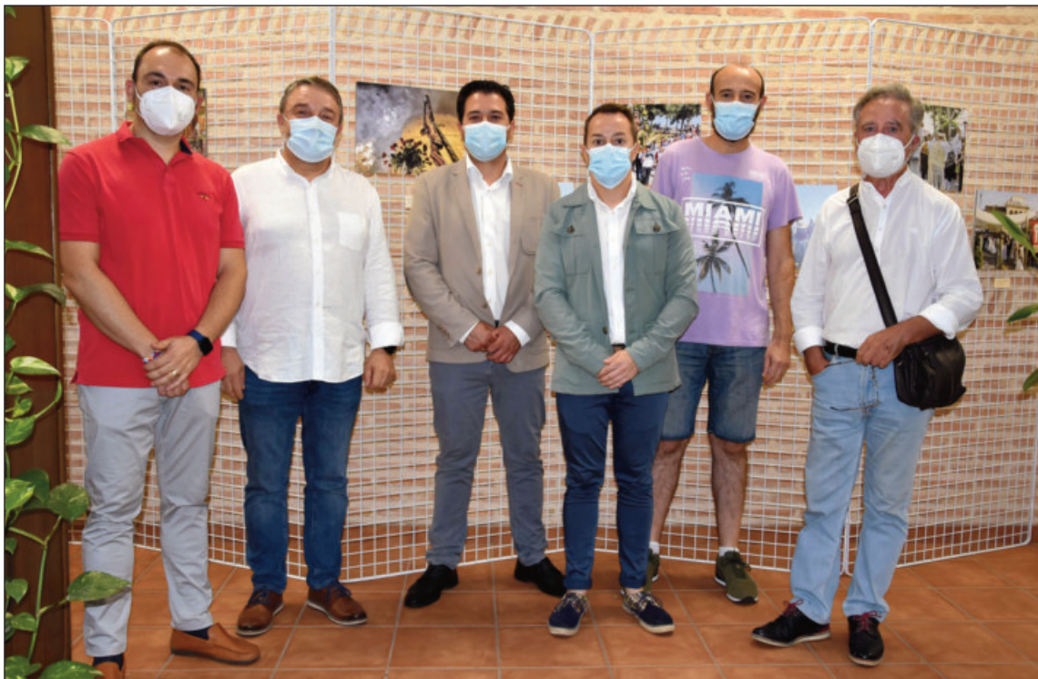
El Diputado provincial de Cultura, junto al concejal de Festejos y miembros de la asociación Malastardes

Un recorrido por la historia y las tradiciones populares