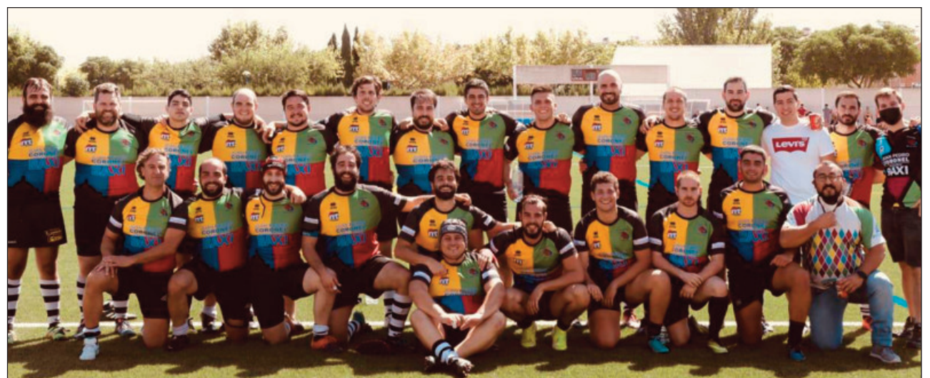
Equipo del Arlequines Rugby Club