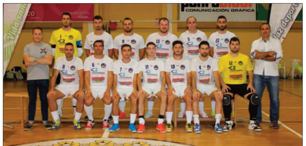
Equipo de Fútbol-Sala