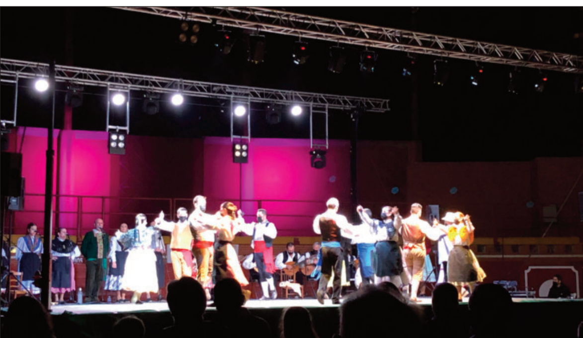
Festival de folklore del grupo de coros y danzas Nazarín