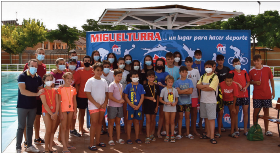
Campeonato de natación