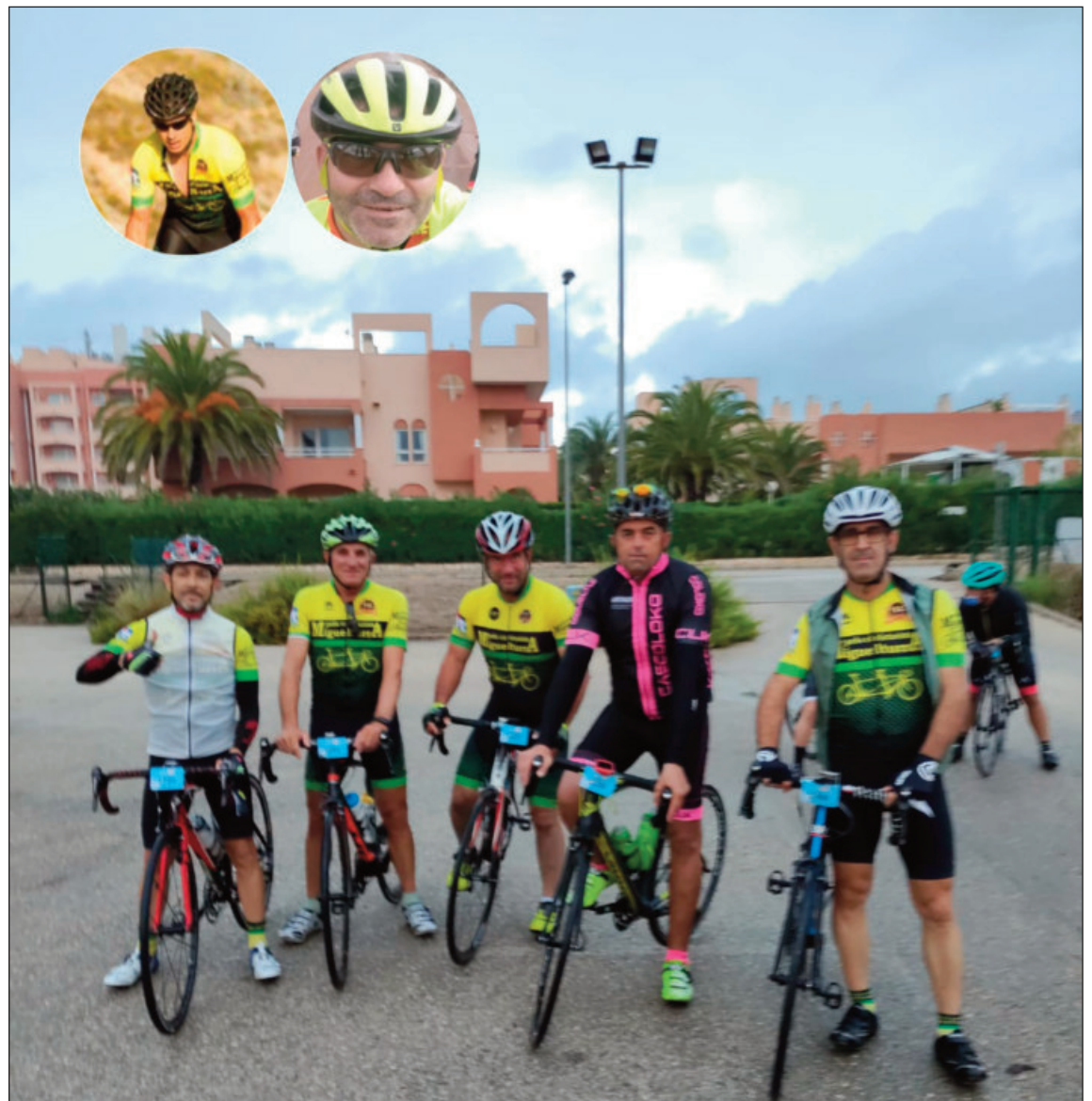
Componentes de la peña Cicloturista de Miguelturra

Volver a realizar una marcha de gran fondo ha supuesto encontramos con los demás y con nosotros mismos en esos momentos de superación personal y al mismo tiempo saborear “sufriendo” lo que realmente nos gusta. Utilizando esta prueba y el deporte como terapia pues es la mejor medicina cuando todo tu alrededor se vuelve oscuro; y sirviéndonos para recuperar nuestra alma y el de la bicicleta porque tanto para el ciclista como para su máquina la vida es movimiento.