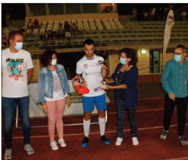
Torneo "Villa de Miguelturra" de fútbol