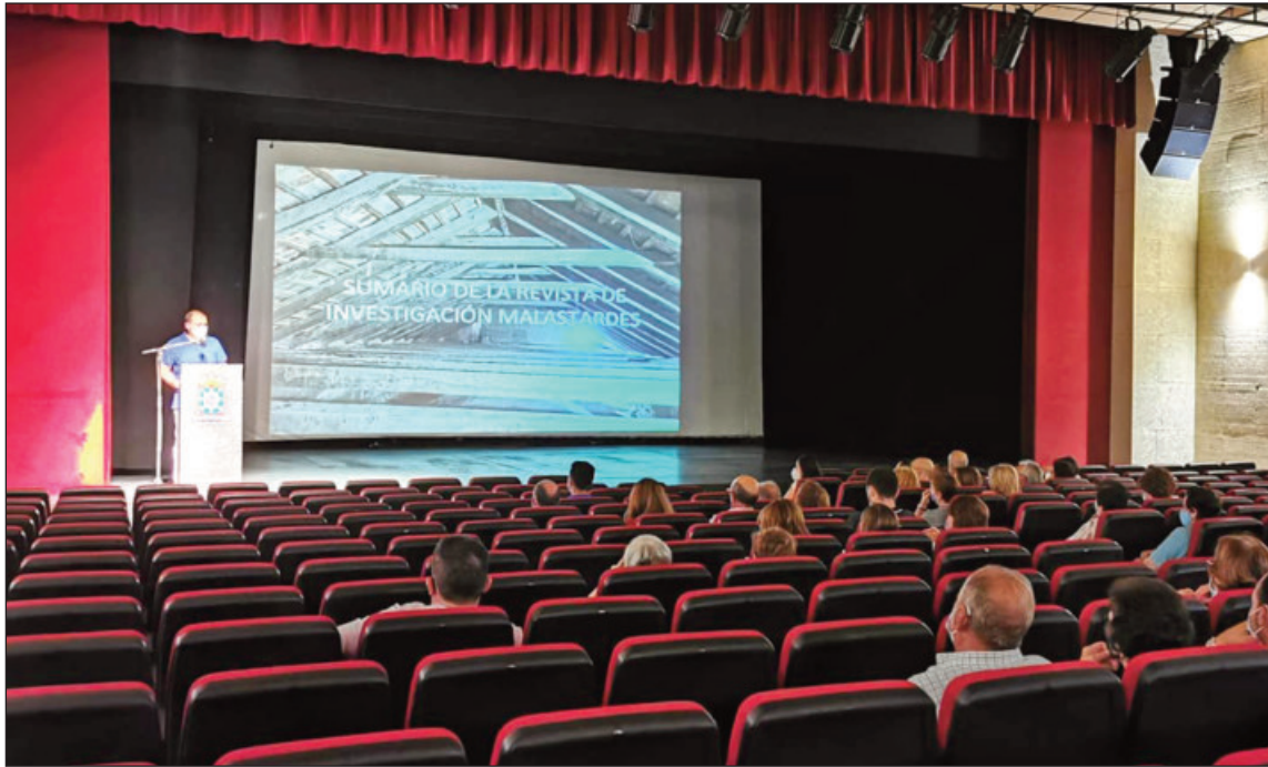
El Teatro-cine Paz fue el espacio elegido para dar a conocer los contenidos de la revista