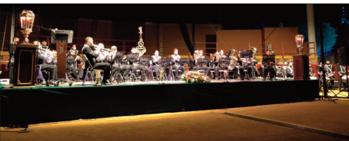
Actuación de la Agrupación Musical Cristo de la Piedad