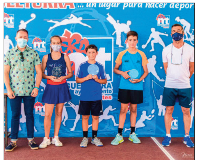
Trofeo infantil de Tenis de Mesa