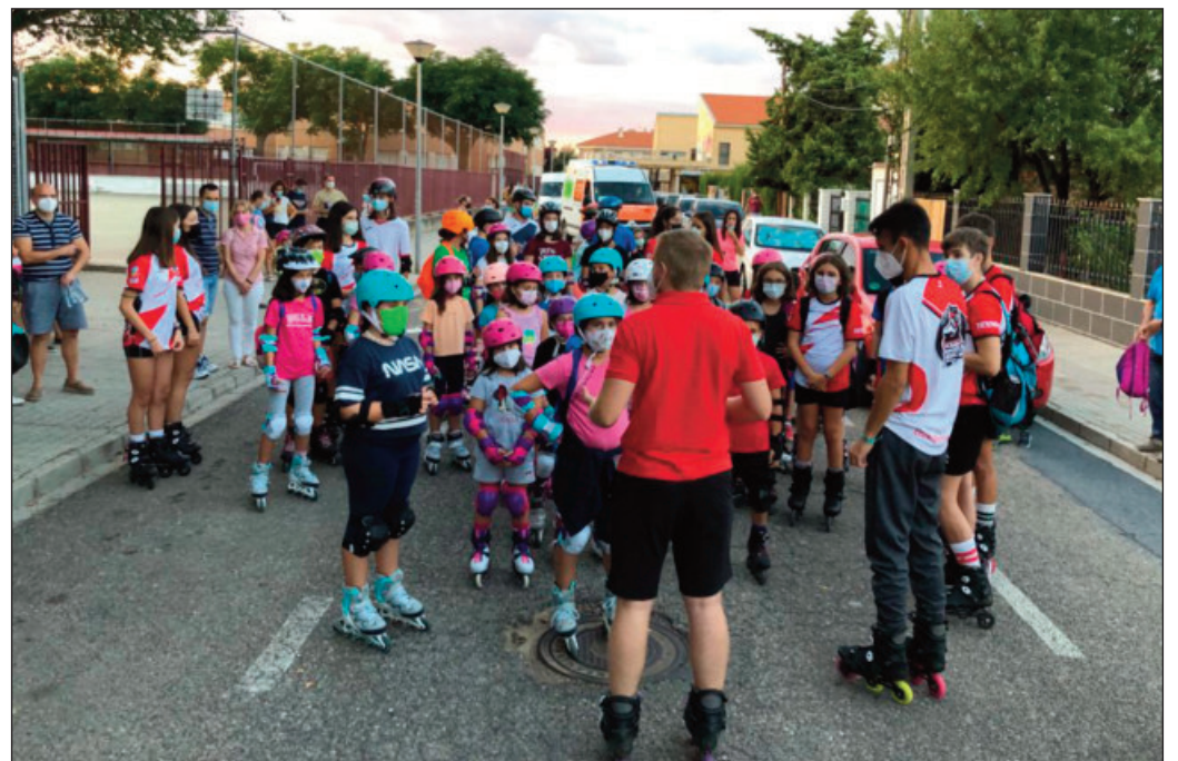
Ruta churriega de Roller Nigth