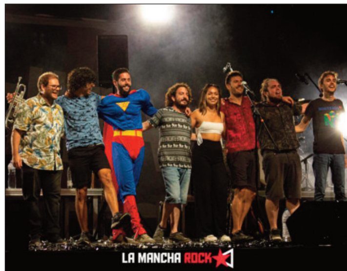
Concierto del grupo local Wahira