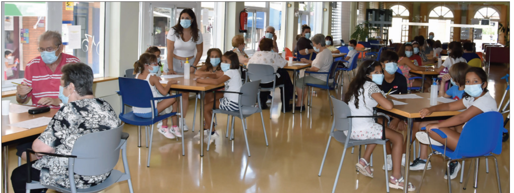
Los niños y niñas han jugado al bingo con las personas mayores del centro

Los niños y niñas inscritos durante la última semana en este Campus de Verano se han desplazaron, en la mañana del miércoles, 1 de septiembre, hasta el Centro de Día, para disfrutar de esta actividad que pone punto y final a todo un verano de ocio y aprendizaje, en el que se han llevado a cabo multitud de actividades.