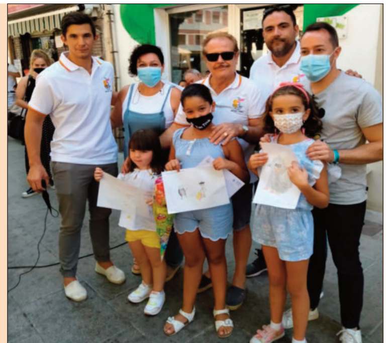
Encierro infantil, Peña taurina Capote de Oro

PEÑA LOS CANSALIEBRES WAHIRA PEÑA CAPOTE DE ORO ASOCIACIÓN AMIGOS DEL CABALLO CD MIGUELTURREÑO EFB MIGUELTURRA CLUB DE TENIS MASQ-SPORT JAVIER RIVAS CASCOLOKO CD LA ESTRELLA FUN BALL GAME CARRERA DE GALGOS ARLEQUINES MIGUELTURRA CLUB DE AJEDREZ FÚTBOL SALA PEÑA CICLISTA CORRECAMINOS CLUB BALONCESTO CLUB PADEL SPORTIA PATINAJE CLUB TENIS DE MESA DALE PEDALES ACAI CULTURA OCIO Y FORMACION