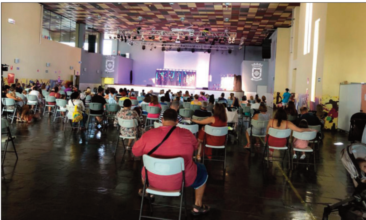
Actuación del grupo de teatro Flauti Flauti