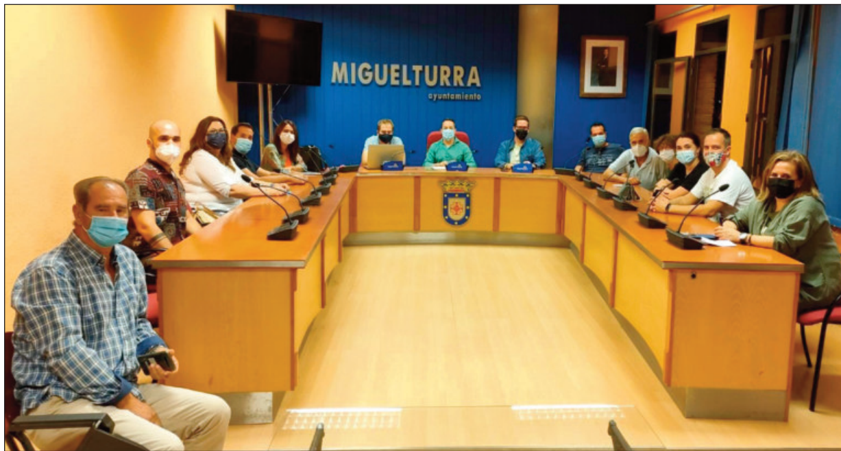
El concejal de Festejos, junto al Rey del Carnaval y miembros de la asociación de Peñas

La decisión de celebrar el Carnaval se tomó después de que se realizara una votación entre los presentes, que se manifestaron a