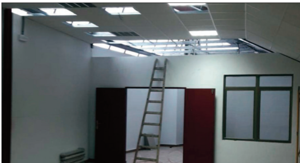
Acondicionamiento acústico del espacio cedido a la Agrupación "Cristo de la Piedad"

permitirán transformar nuestro pueblo y entorno, sino que también mejora el día a día de nuestros vecinos y asociaciones".