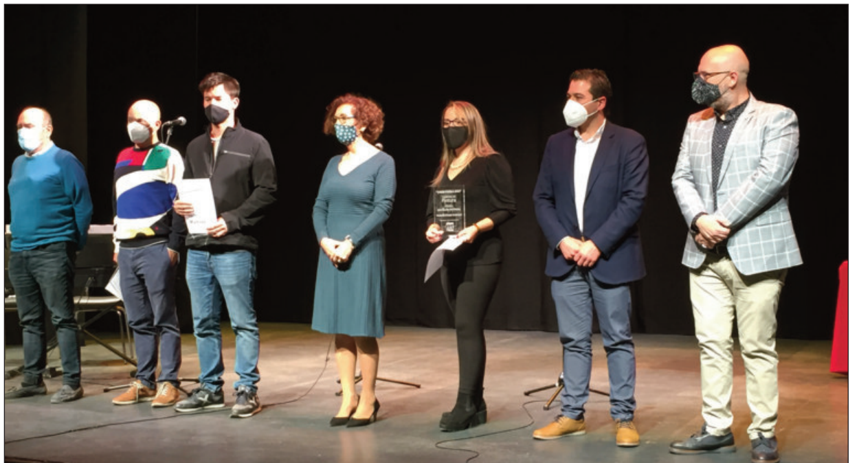
Todas las personas premiadas recibieron sus premios con observancia de las medias sanitarias