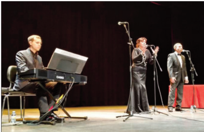
Espectacular fue la actuación del trío de San Peterbusgo, Amor Fino

El acto contó con la actuación del trío "Amor Fino", una confraternidad de músicos profesionales formados académicamente en los mejores conservatorios de Rusia, unidos por el Amor hacia la música y la gente. Presentan obras célebres de la música clásica internacional, inter-