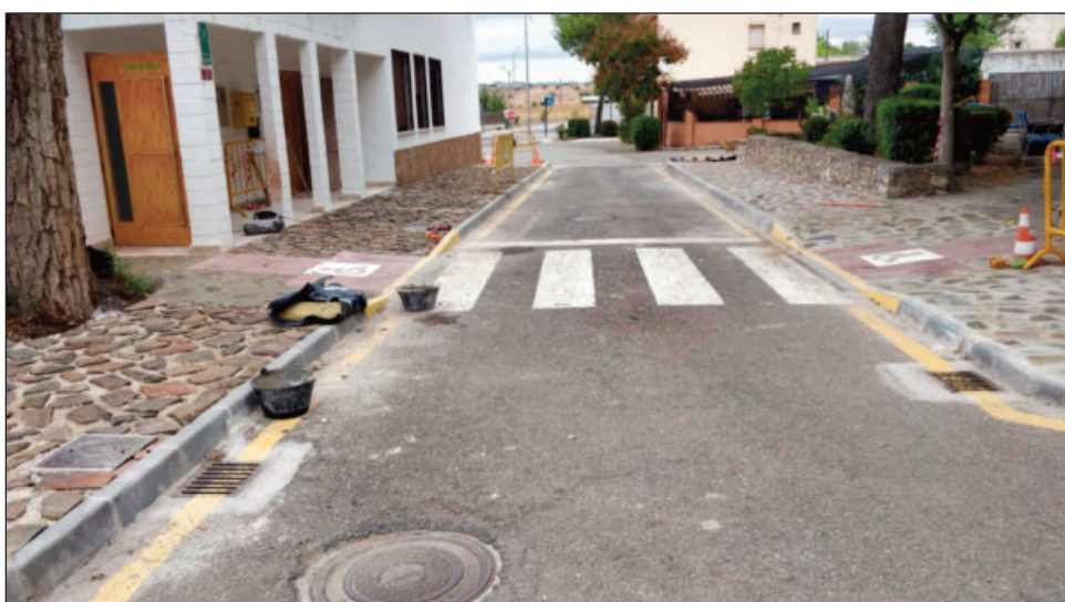
Reposición de piedra natural en acerados del Centro Social de Peralvillo