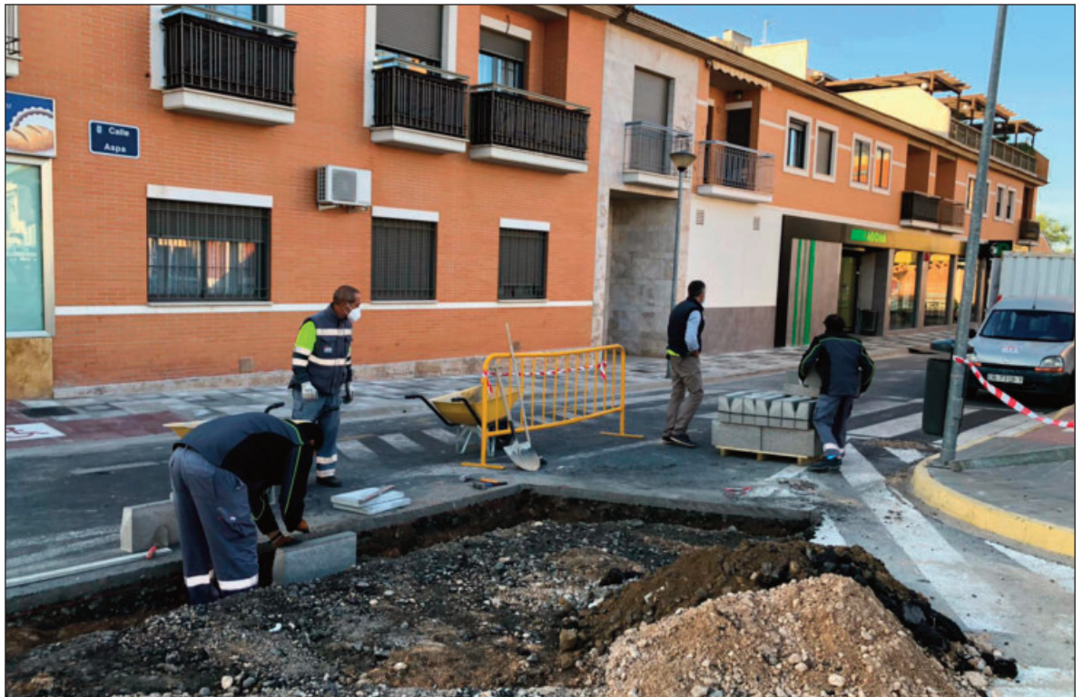
Se están ensanchando los acerados en la calle Aspa

Todas estas obras se suman a los trabajos realizados de mantenimiento en el mobiliario urbano, reparaciones con asfalto de bacheo en viarios y caminos, lim-