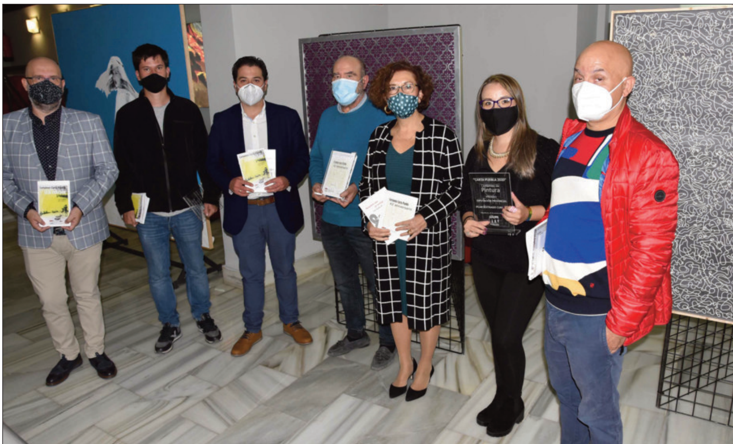
Las autoridades junto a ganadores y ganadora de los diferentes premios, en el hall del teatro

Actuó el trío Amor Fino con espectáculo " De Corazón a Corazón"