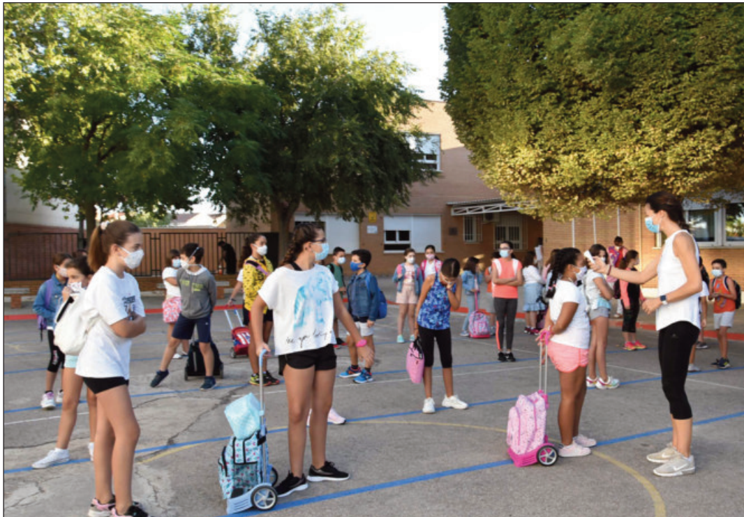
Alumnado del colegio El Pradillo en la toma de temperaturas para acceder al centro

El AMPA del CEIP El Pradillo de Miguelturra ha puesto en marcha una campaña de "crowdfunding", llamada "PRADILLO COVID FREE", para dotar a las aulas del centro de purificadores de aire con filtros HEPA.