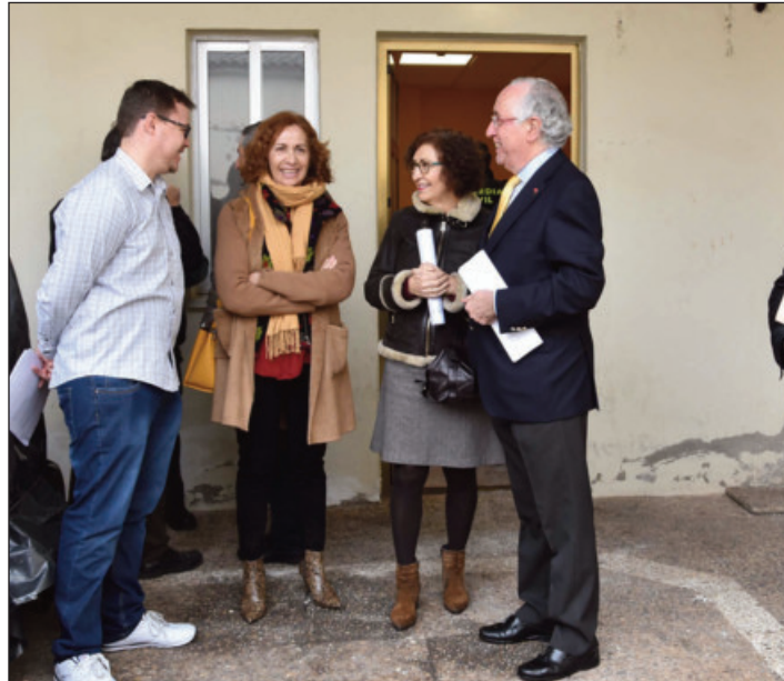
Visita a las instalaciones por parte de las autoridades (foto previa Covid)

En estas dependencias, se atenderá a toda la ciudadanía, en horarios de 09:00 a 14:00 de lunes a viernes, estando disponible las 24 horas del día el teléfono de urgencias de la Guardia Civil 062, donde se dará respuesta cualquier incidencia.