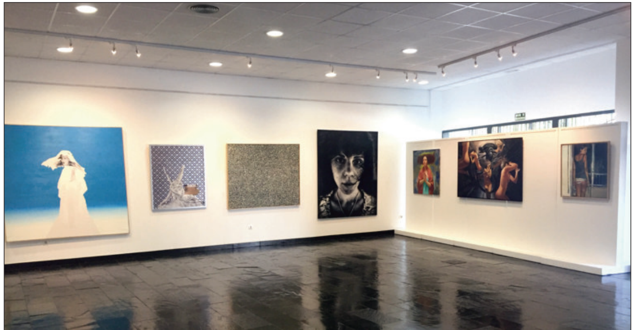
Los cuadros seleccionados, de entre más de 300, se pudieron ver en la Sala de Exposiciones del CERE

Hay que agradecer también su esfuerzo por suplir, con solo dos días de antelación, la baja de última hora del grupo Malevaje, provocado por un contagio del covid 19.