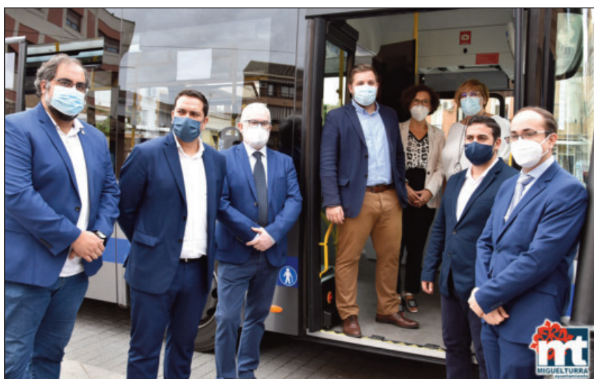
El consejero de Fomento y la Alcaldesa con el resto de autoridades, en el nuevo bus

Hernando ha destacado que este vehículo supone un compromiso con el medio ambiente ya que reduce las emisiones de CO2 en un 25 por ciento, el equivalente a la absorción de 96 árboles adultos en un año. Además, ha asegurado que ésta "es una llamada de atención al reto del futuro, nos indica hacia donde tenemos que ir, y lo tenemos que hacer lo más rápido posible para llegar al mismo compromiso con el medio ambiente como Miguelturra o Ciudad Real y muchos municipios y capi-