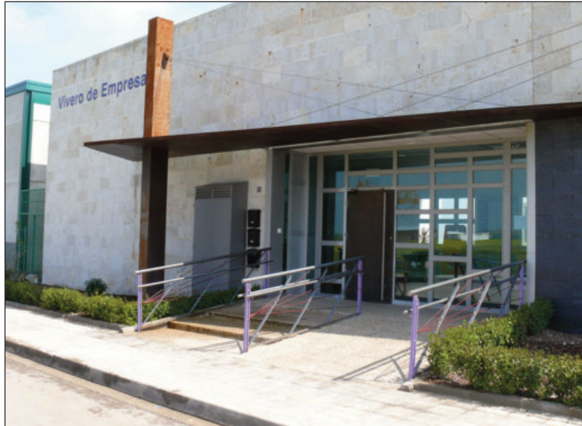
Instalaciones del vivero de empresas municipal

El Área de Promoción Económica, Desarrollo Industrial y Empleo del Ayuntamiento de Miguelturra, va a desarrollar un estudio del estado del desempleo en la localidad con el objetivo de orientar las políticas locales de empleo a las características concretas que se detecten en el tejido de desempleados/as de la localidad, diseñar programas de formación específicos y crear una base de datos de desempleados, para que, cuando las empresas soliciten candidatos se pueda ayudar desde este Área.