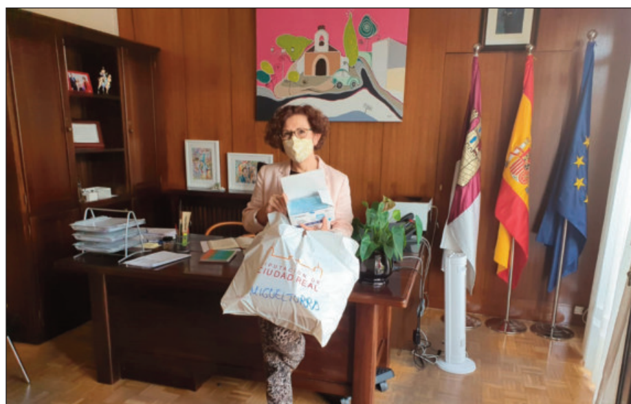
La Diputación Provincial colaboró en el reparto de los municipios