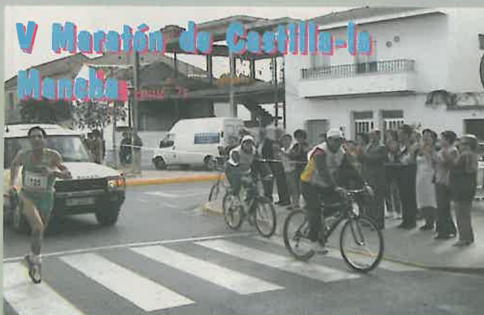
V Maratón de Castilla-La Mancha