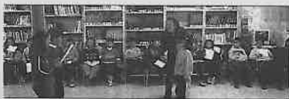
loteca Municipal de Miguelturra con la animación "La gallina ciega de Gloria Fortes"