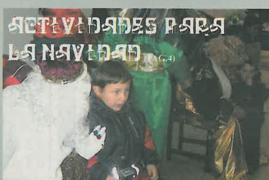
ACTIVIDADES PARA LA NAVIDAD (pág. 4)