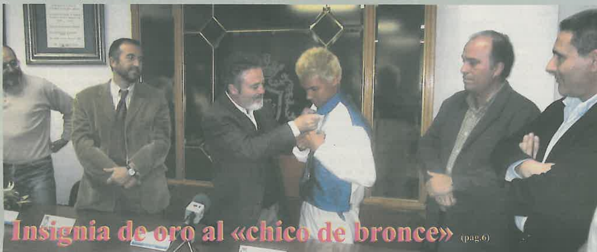
Insignia de oro al «chico de bronce» (pág.6)