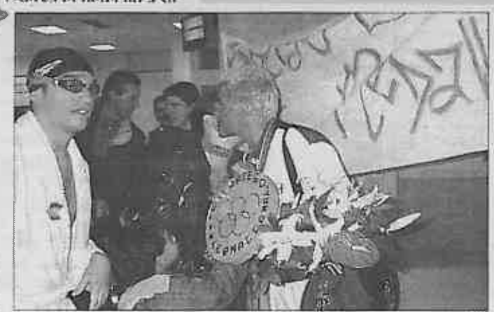
El joven de la zapatería, con bañador, aletines y gorro, le dio la "medalla" al chaletero internacional