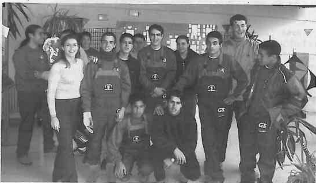
Alumnos y monitores del curso 2000/01 en la Casa de Cultura

ración de un año, siendo los últimos 6 meses en los que los alumnos permanecerán contratados por el ayuntamiento al tiempo que completan su formación ocupacional. (M.G.R.)