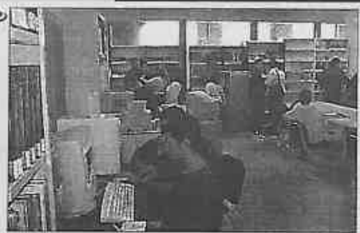
200 nuevas personas se han inscrito en los dos últimos meses

Para el uso de Internet es necesario ser socio de la Biblioteca y reservar hora previamente, ya que debido a la enorme demanda, se han tenido que establecer turnos en horario de mañana y tarde con el fin de que el usuario disponga con seguridad, de hora determinada para las con-