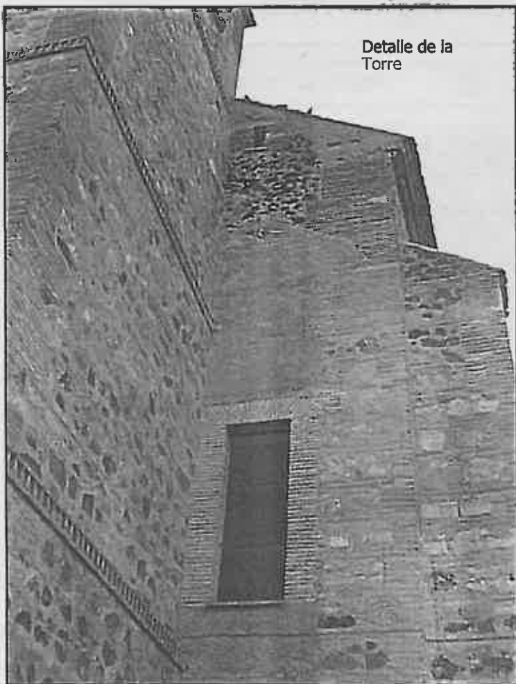
Detalle de la Torre

tipo de advocación fue el generalmente utilizado en la primera etapa del poblamiento, y deberíamos pues pensar