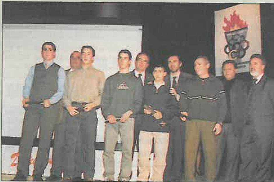
Los cinco finalistas recibieron un regalo especial.