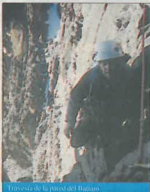
Travesía de la pared del Batiam