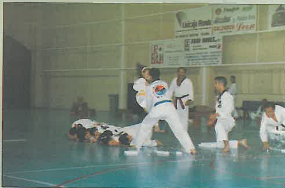
El Taekwondo presenta un amplio abanico de competidores cualificados