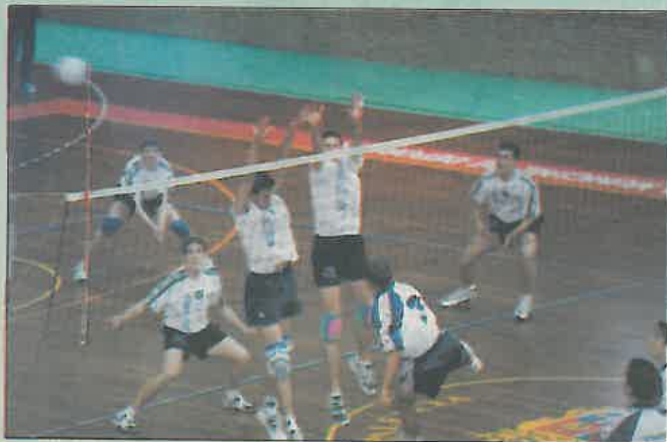
El voleibol ha conseguido para Miguelturra los mejores logros colectivos.