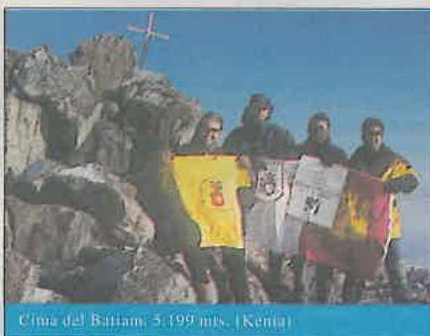
Cima del Batiam, 5.199 mts. (Kenia)

No obstante, los miembros del equipo se trajeron la cima del pico más difícil (monte Kenia) y el más alto de todo el continente (el tanzano y popular Klimanjar). Los problemas militares entre la República del Congo y Uganda impidieron la entrada en éste último país, lo que imposibilitó escalar los tres «cincomiles» que allí hay, teniendo que cerrar así el proyecto el día 14 de ene-