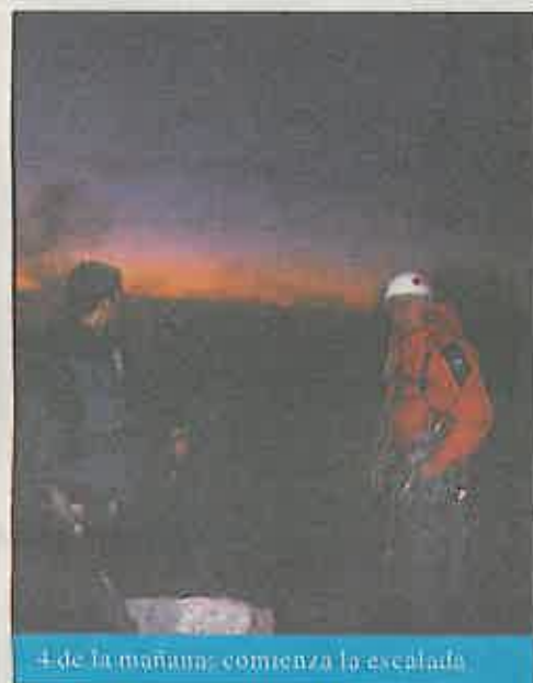
4 de la mañana: comienza la escalada