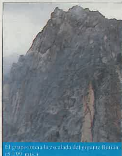
El grupo inicia la escalada del gigante Batiam (5.199 mts.)