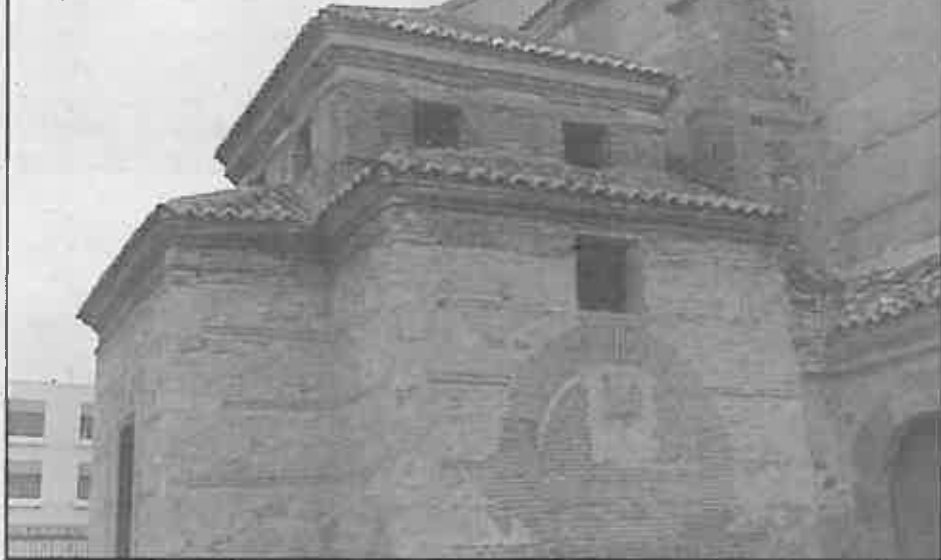
Capilla del Rosario

actualmente aparecen pintadas al fresco con las figuras de unos ángeles que portan los signos de los evangelistas, y que actualmente acoge al Santísimo Sacramento.