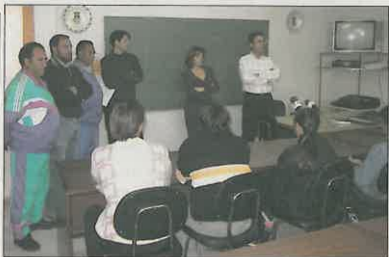
Momento de la inauguración del nuevo cursos de Garantía Social (J.C.M.)

Recordemos que estos cursos están promovidos por el Ministerio de Educación y Cultura y son cofinanciados por este mismo organismo y el ayuntamiento de Miguelturra, siendo su duración de un año completo: una primera fase de seis meses para la formación teórico-práctica de la especialidad laboral elegida, y una segunda de alternancia con el trabajo, durante la cual todos los alumnos disponen de un contrato laboral a tiempo parcial que les permite tener un salario de unas cincuenta mil pesetas mensuales. En ambas fases la formación básica, principalmente en materias instrumentales (lenguaje y matemáticas) y la formación para la búsqueda de empleo, ocupan una importante labor complementaria. La actividad es, en ambas fases en horario único de mañana. (M.G.)