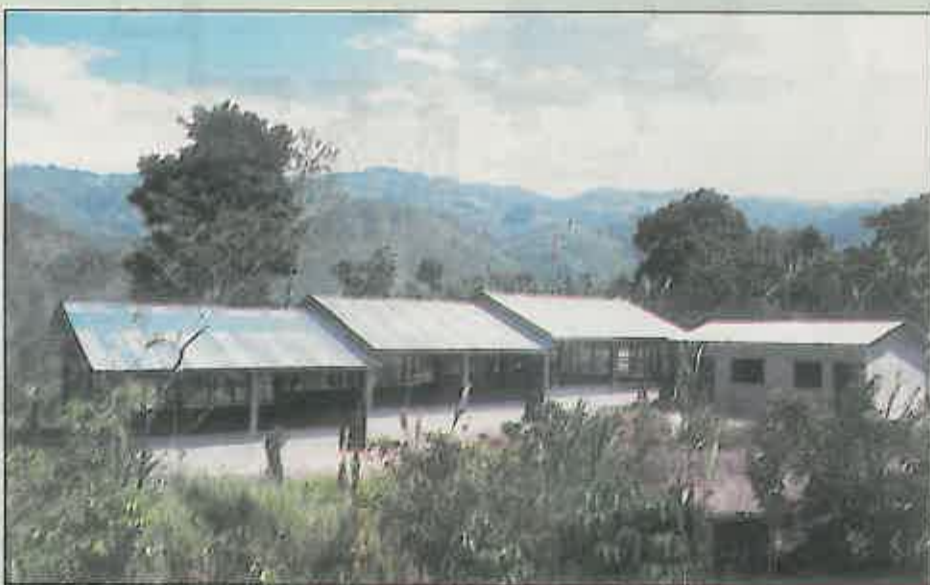
Con esta bella panorámica, que nos muestra la rica naturaleza del entorno, se ve el avance de las instalaciones de la granja avícola.