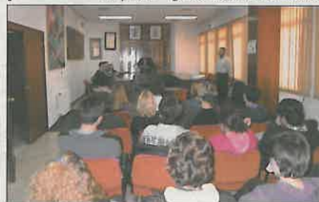
El Alcalde da la bienvenida al grupo en el salón de plenos.

y el resto chicas. El hospedaje se ha realizado en casas particulares, en algunos casos, en las mismas de los