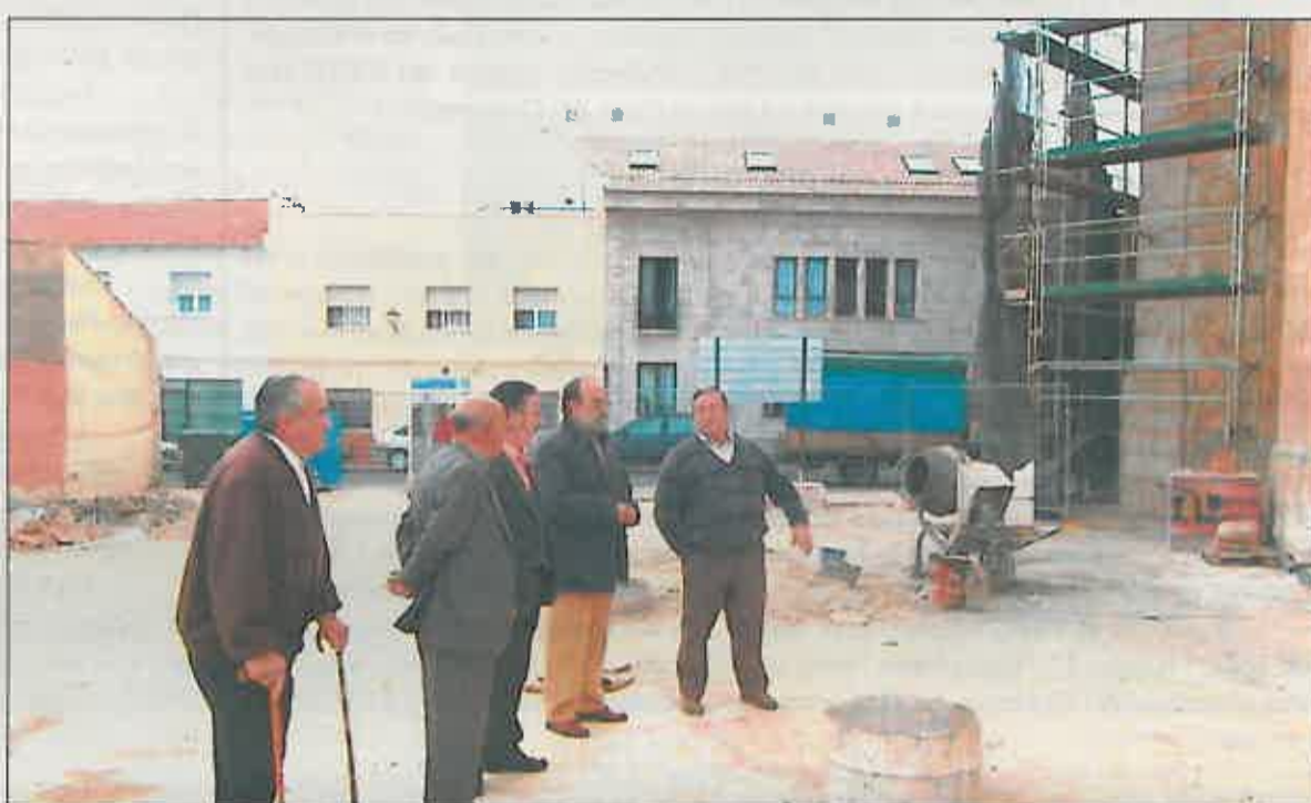
Momento de la visita a las obras de remodelación de la ermita del Cristo.