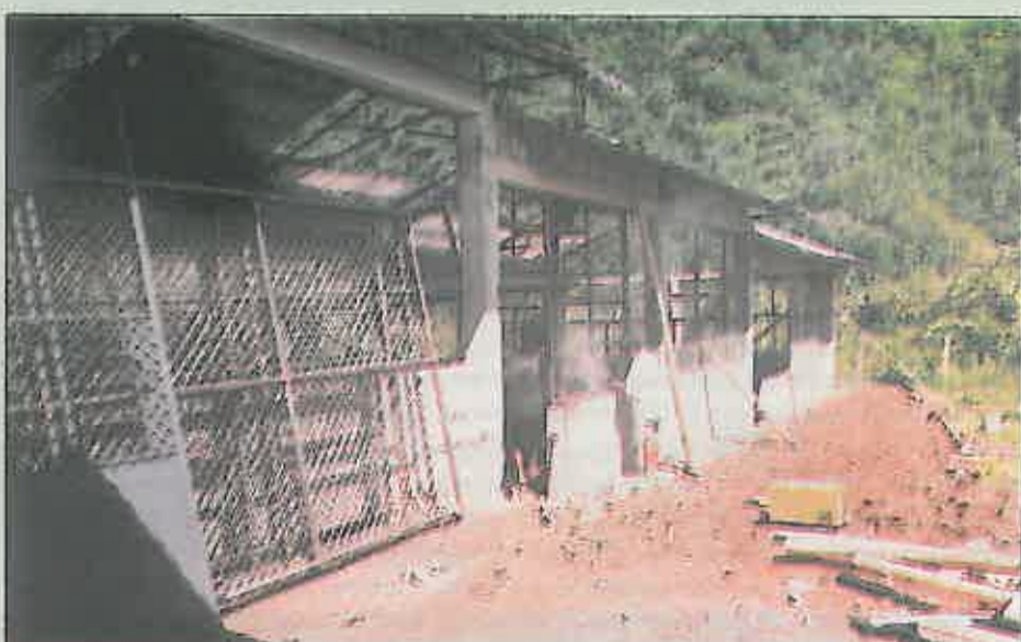
Los obreros proceden a instalar diferentes vallados en los huecos de las naves, para evitar que las aves puedan escapar del recinto.