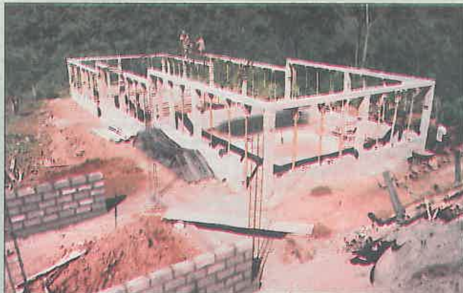
Operarios trabajan en la estructura básica de la granja. (primera fase)

Nota: Les rogaría me hicieran el servicio de enviarme el periódico del Ayuntamiento, con el objetivo de estar más unido con mi pueblo.