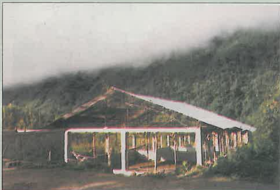
En esta segunda imagen se ve la construcción de la cubierta