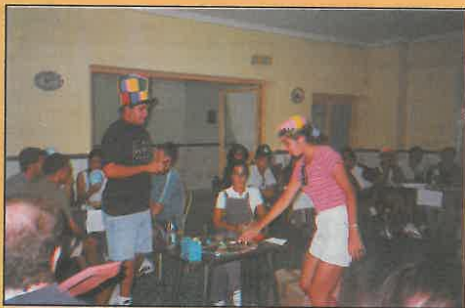
Hasta doce equipos participaron en el campeonato de trivial.