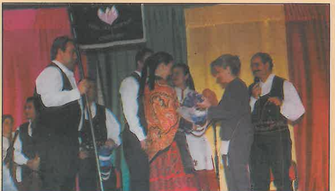
El folklore tiene una cita anual en la Semana Cultural de la Plaza de la Virgen