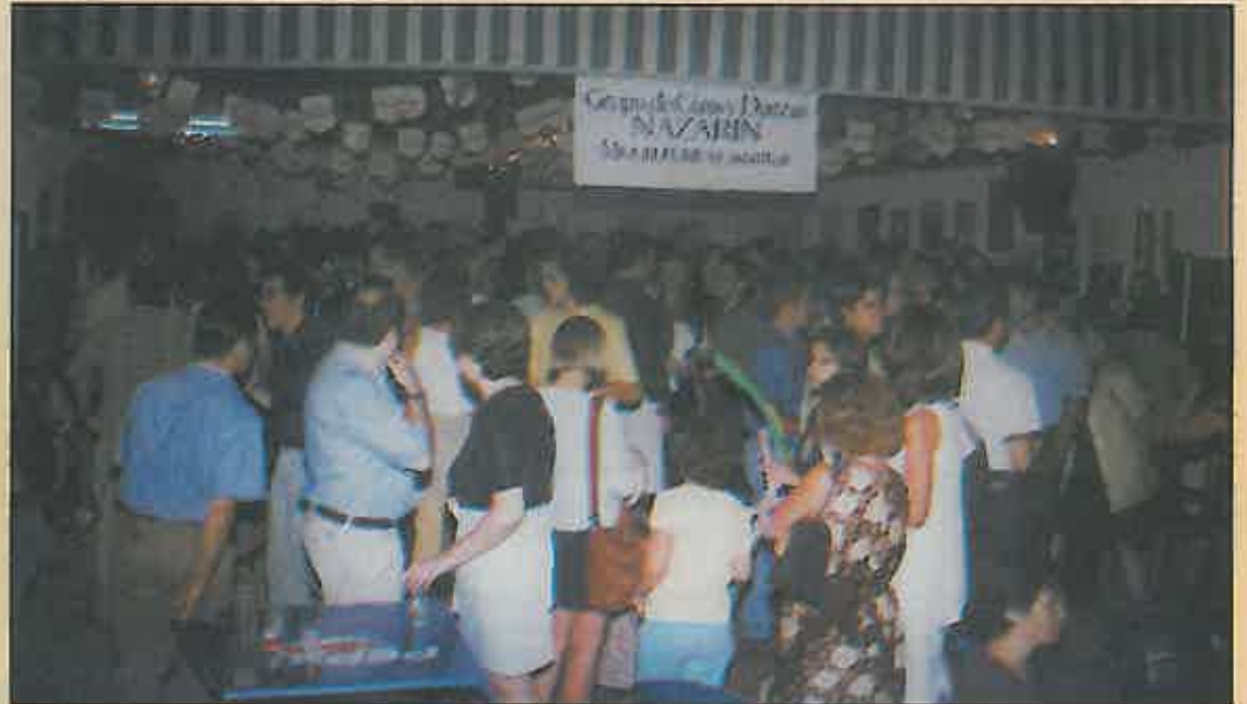
Las casetas siguen siendo un lugar de concentración de jóvenes y mayores.