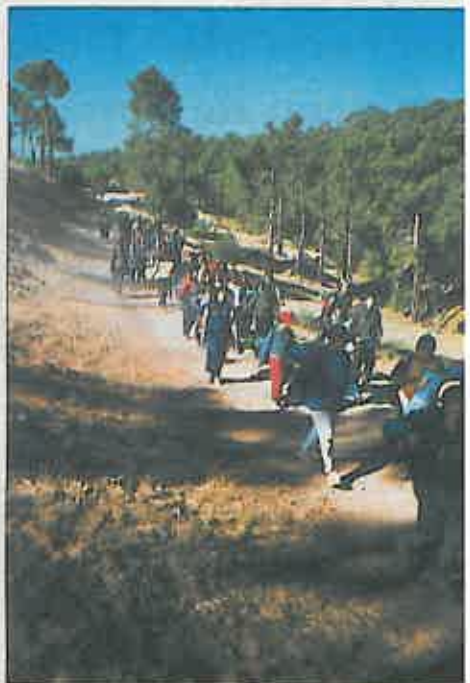
Niños durante una marcha del campamento, 1999

ORIENTACION Y TOPOGRAFIA/ OBSERVACION DIRECTA DE AVES, PARTICIPACION EN PROGRAMAS DE RADIO