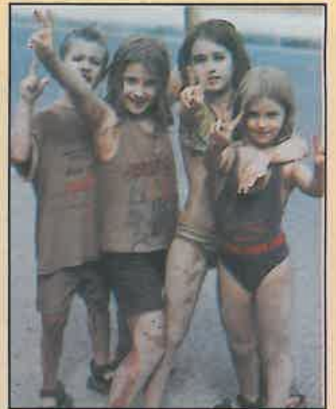
La fiesta del agua terminó siendo la del barro.

En resumen, otras fiestas que siguen basando su interés en la participación de todos los migueltureños y visitantes