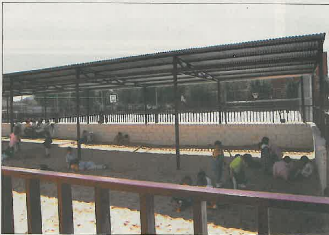
El Ayuntamiento, entre otras, realizó este verano las obras de ampliación, arreglo, remodelación y mejora del patio de recreo de Educación Infantil del C.P. "Benito Pérez Galdós", muy demandadas por toda la comunidad escolar.

Por otra parte, se han realizado otras obras menores tanto en el edificio de c/ Ancha, perteneciente al C.P. "El Pradillo", de arreglo de ventanas; como en Centro de Atención a la Infancia, de ampliación, la cual permitirá poder acoger más niños. Además de las habituales obras de arreglos, limpieza y pintura que se llevan a cabo todos los veranos en todos los centros de enseñanza.