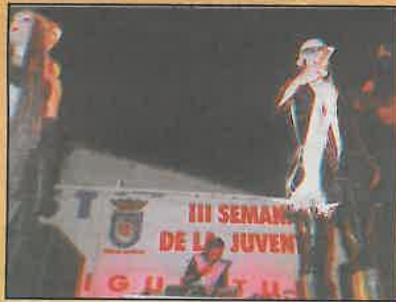
La fiesta nocturna fue de lo más novedoso y original.

En la confección del programa de actos han participado las siguientes asociaciones locales: Barrio Oriente, JOC, Juventudes Socialistas, Nuevas Generaciones, Agrupación Astronómica, Nuevo Teatro, Protección Civil, Juvenes Cum Futuro, Música Rock, Fútbol Femenino, Flauti Flauti, Arte Danza y Super Pikes.