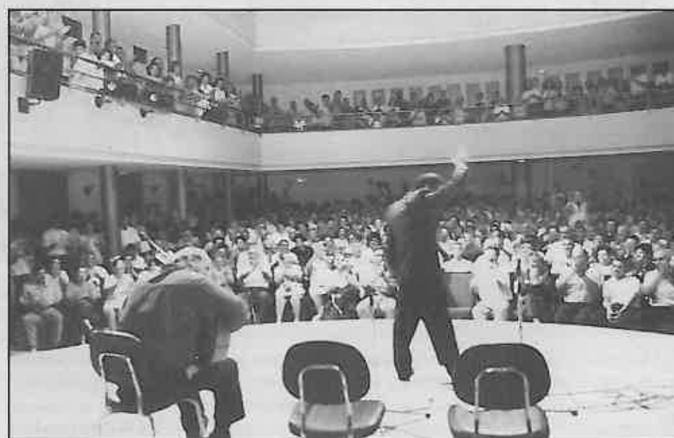
Este aspecto presentaba la sala de la Casa de Cultura, durante las actuaciones.

sión de declarar desierto el primero de los premios, ya que el jurado nombrado por la peña consideró no suficiente el nivel de los participantes.