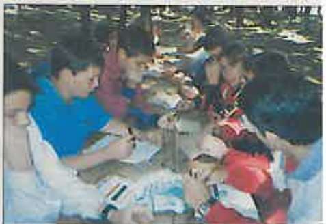
Los talleres son una de las actividades educativas realizadas en los campamentos (1999)

El plazo de inscripción queda abierto hasta el 10 de octubre de 1999. Si todo esto te resulta interesante y deseas recibir más información acércate por el Aula de Medio Ambiente de Miguelturra situado en el antiguo matadero o bien llámanos al 926 24 22 56 ó 630 661 443.