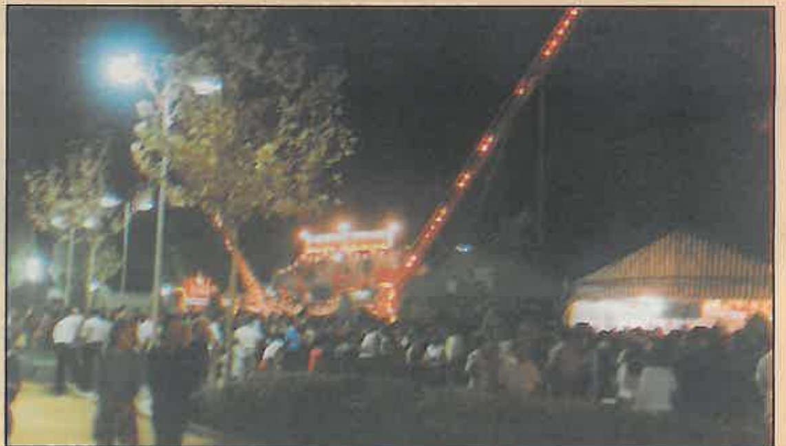
El ferrial ha contado por primera vez con atracciones para jóvenes.