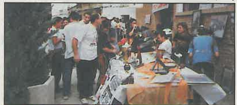
La feria de asociaciones se celebró en el parque.

Organizada por la concejalía de Juventud del ayuntamiento de Miguelturra y con la colaboración de la Consejería de Educación y Cultura se celebró del 10 al 18 de septiembre una nueva edición de la semana cultural de la juventud, con un amplio programa de actividades, alguna de las cuáles resultaron novedosas, llamando la atención de numeroso público. Así ocurrió por ejemplo con la actuación de Drag Queen y