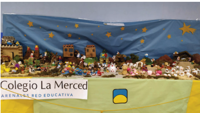
Primer Premio Belenes, sección colectivos