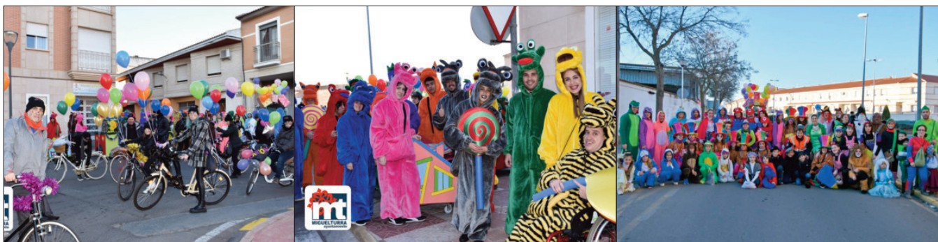
La asociación de Bicis Clásicas repartieron el carbón. Mientras, Flauti Flauti y el club Fondistas de Miguelturra dieron las notas de color a todo el desfile, con un eminente sabor local

Por último, hay que destacar la colaboración de Protección Civil y Policía Local, Área de Cultura, Comunicación y Servicios del Ayuntamiento de Miguelturra.