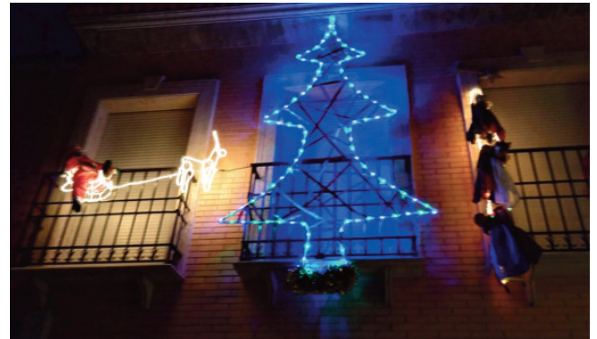
Segundo Premio de Adornos Navideños: balcones y ventanas