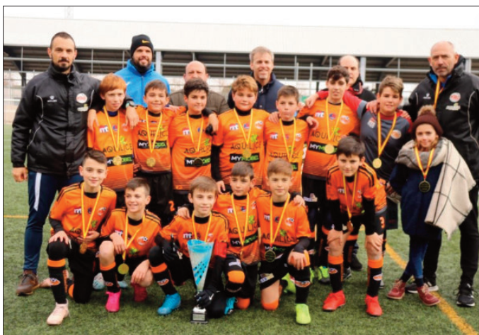
Escuela de Fútbol de Miguelturra