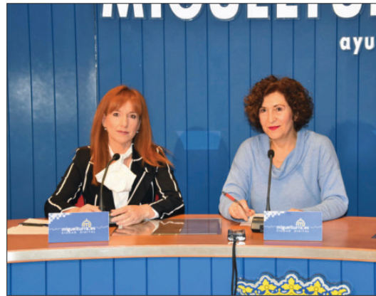
La Alcaldesa y la concejala de Empleo dieron a conocer los detalles del conflicto