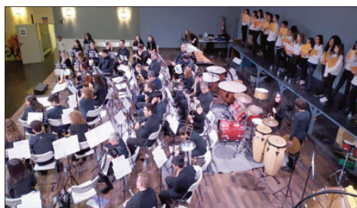
Banda Juvenil y Coro Infantil de la Escuela de Música

La recaudación, que ascendió a 646 €, se entregó íntegramente a las asociación VivEla e irá destinada al proyecto de investigación internacional "Metabolip", con sede en el Hospital Nacional de Paraplégicos de Toledo. Pág 5