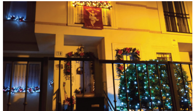
Primer Premio de Adornos Navideños: balcones y ventanas