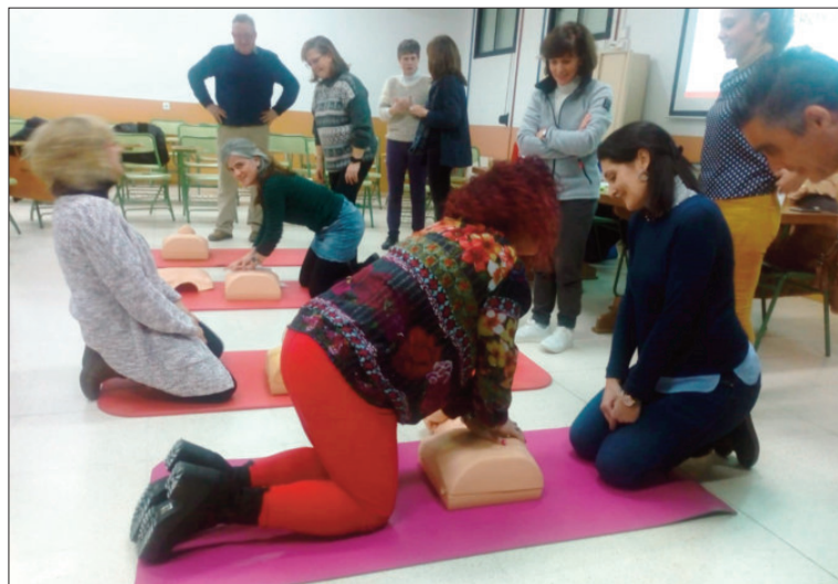
Profesorado e integrantes del AMPA recibieron las instrucciones pertinentes para el manejo del equipo

Gracias a la Asociación de Madres y Padres de Alumnos (AMPA)