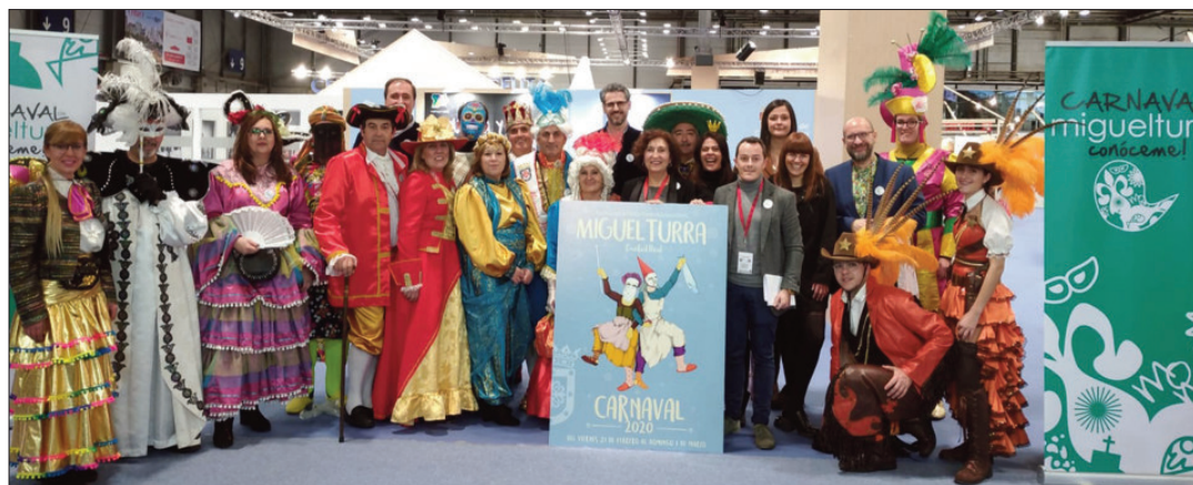
La nueva marca del Carnaval miguelturreño tuvo su puesta de largo en la Feria Internacional de Turismo

"Un antifaz para simbolizar nuestra máscara callejera, esa ma-