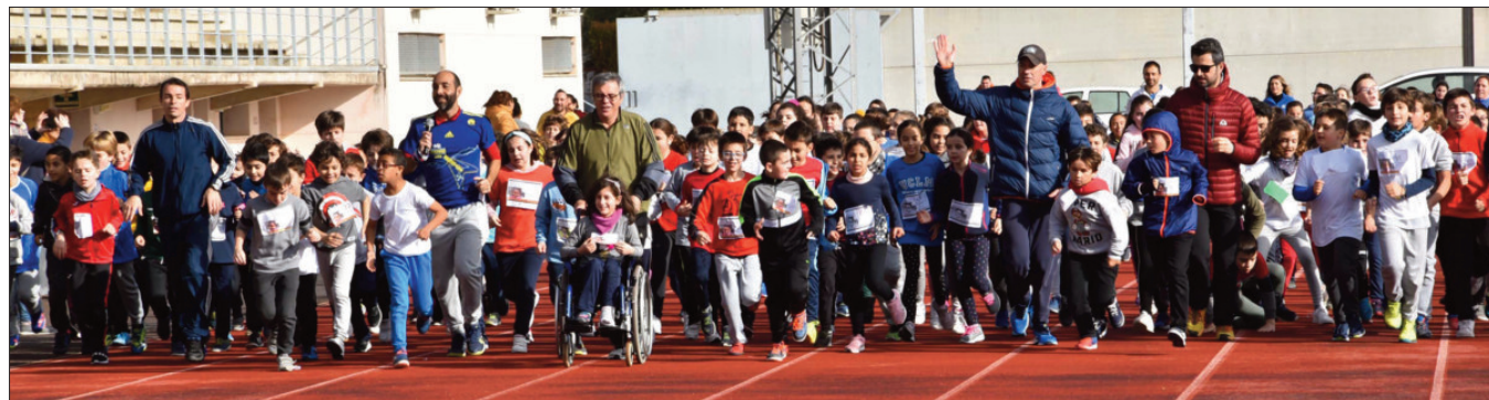
Alumnado junto a profesores y profesoras de todos los colegios se desplazaron al Estadio Municipal para esta jornada de deporte solidario

DE TODOS LOS COLEGÍOS DE LA LOCALIDAD EN FAVOR ONG "SONRISAS Y MONTAÑAS"