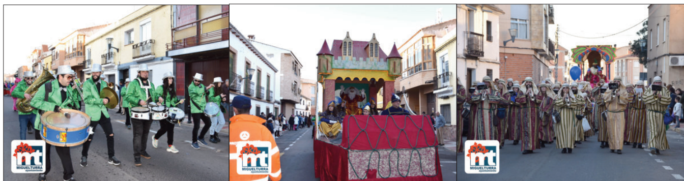
La parte musical corrió a cargo de la Charanga Alhigüi y de la Agrupación Musical "Cristo de la Piedad". Protección Civil garantizó la seguridad a lo largo de todo el recorrido