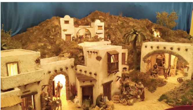
Primer Premio Belenes, sección familiar