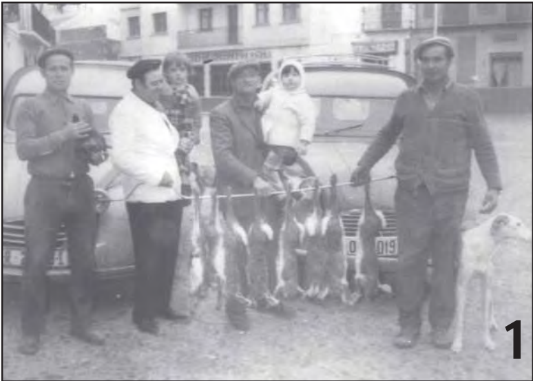
Isabel Muñoz Molero nos deja las siguientes fotografías: