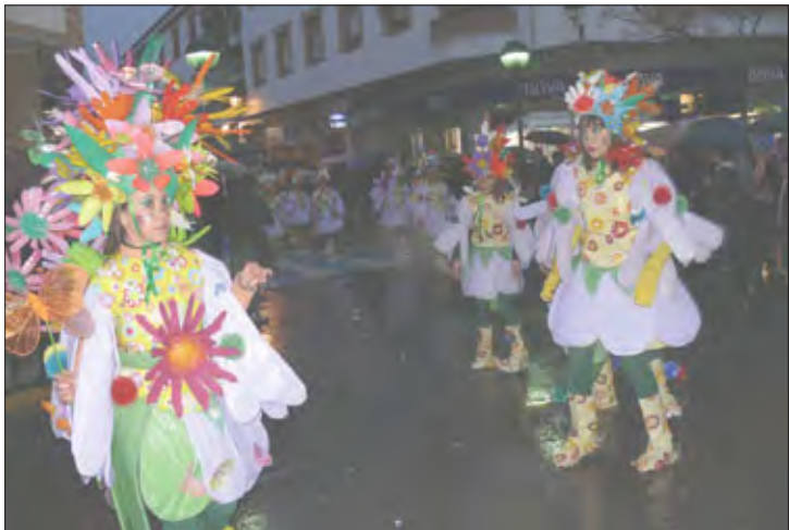
Peña «Barón Amarillo»