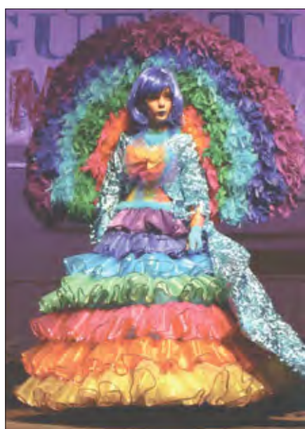
Premio Traje Individual