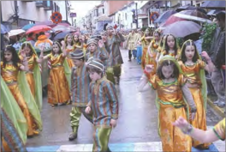
Peña «Arco Iris» (Fuente El Fresno)