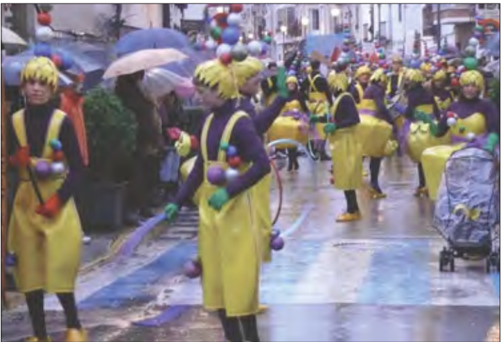
Peña «El Bufón»