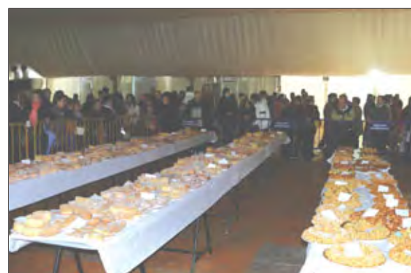
Platos presentados al concurso de Fruta en Sartén