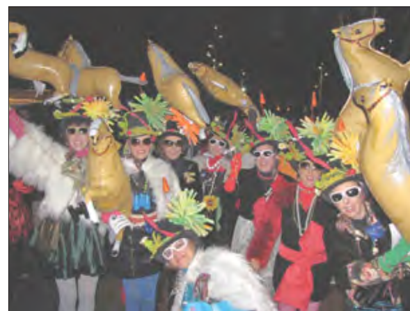
Grupo de máscaras el martes de carnaval