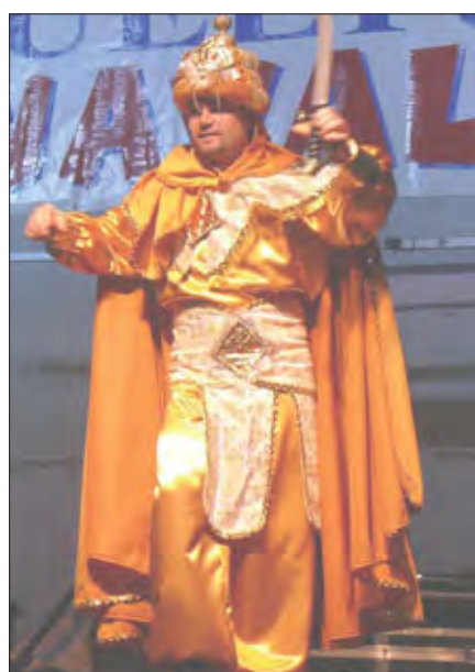
Premio Traje de Hombre