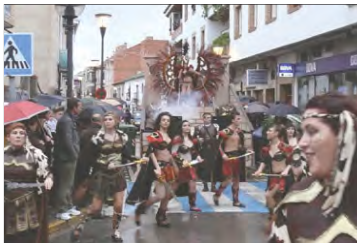
Peña «El Pilar» (Ciudad Real)