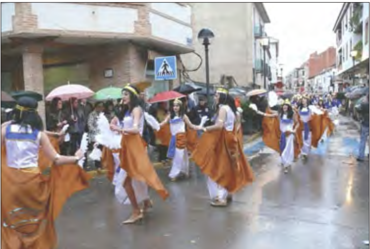
Charanga «El Alhigüí»

de diablos y ángeles. El primer premio de carrozas recayó en Los Remaches, de Moral, y su Circo del Sol, y el segundo galardón, para Los Tunantes, de Piedrabuena.