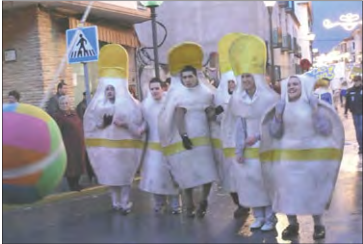
Peña «Los cansaliebres»