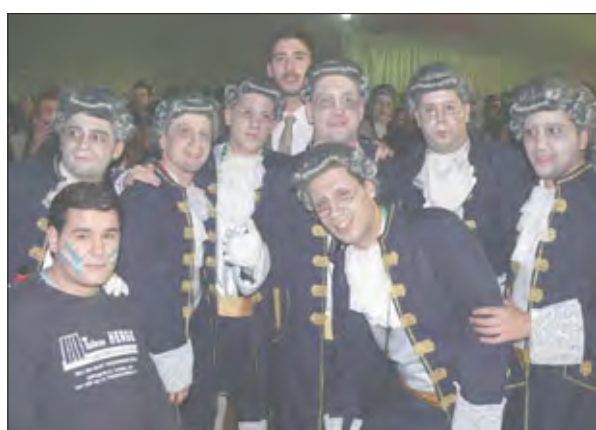
Almodóvar ganó el XXX concurso de Chirigotas