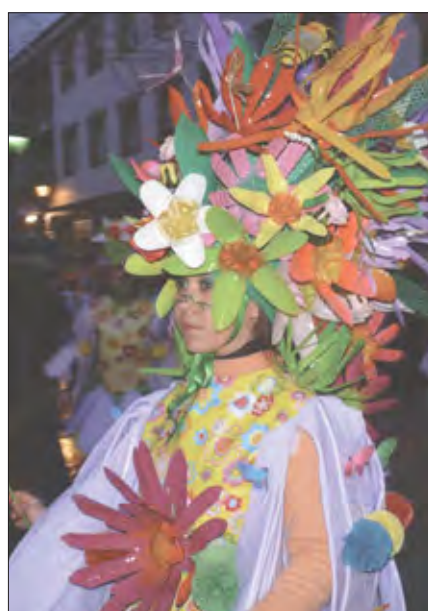
Premio Traje de Mujer