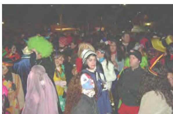
Mascarada en la zona del parque