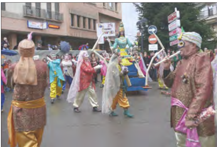
Peña «Máscaras Mayores»