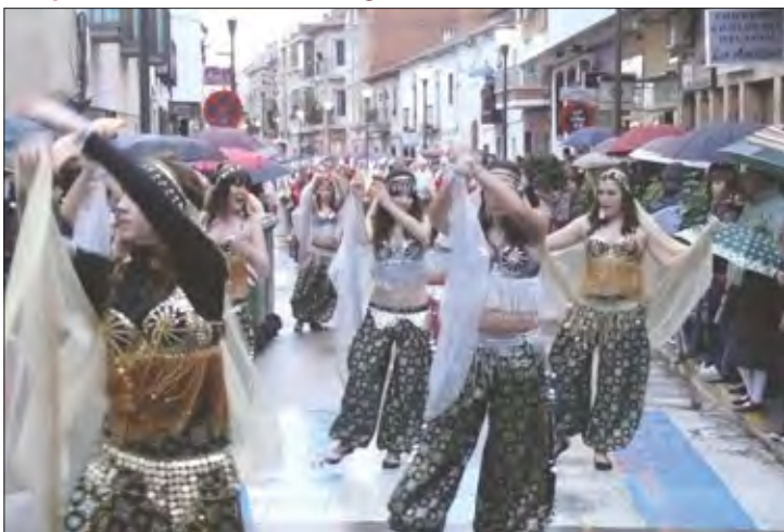
Peña «La Cabra»