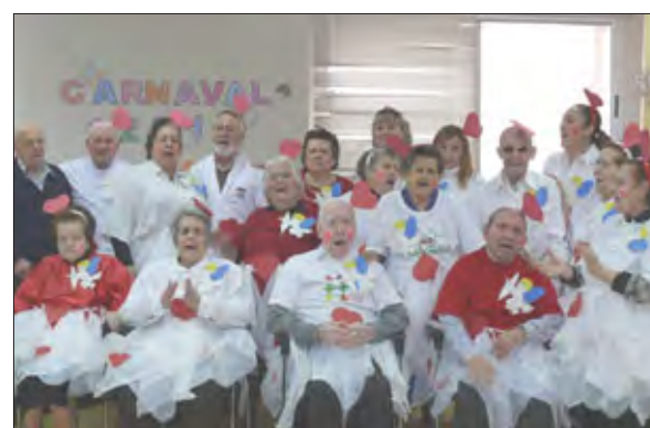
Grupo de máscaras de Estancias Diurnas