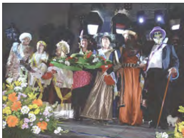
Proclamación Máscaras Mayores 2010