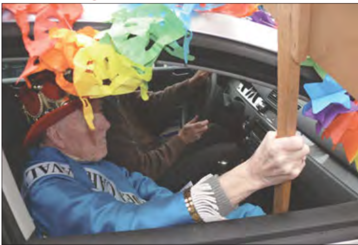
El Rey del Carnaval