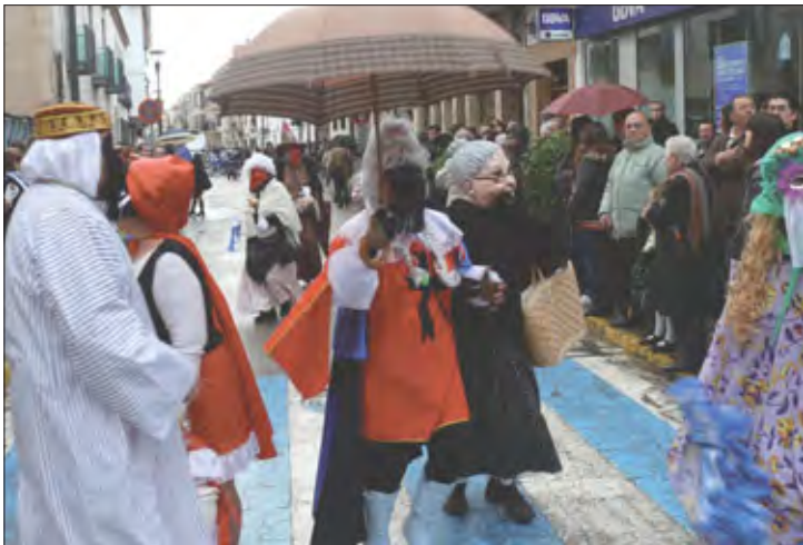
Grupo de «Máscaras callejeras»