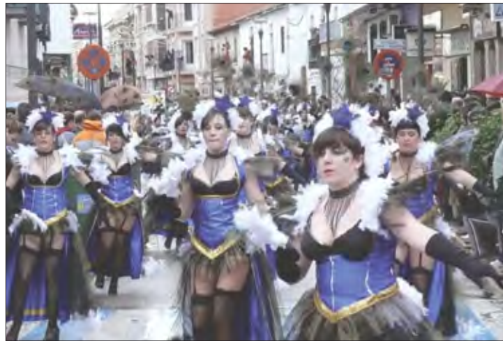
Peña «Fantasía» (El Robledo)