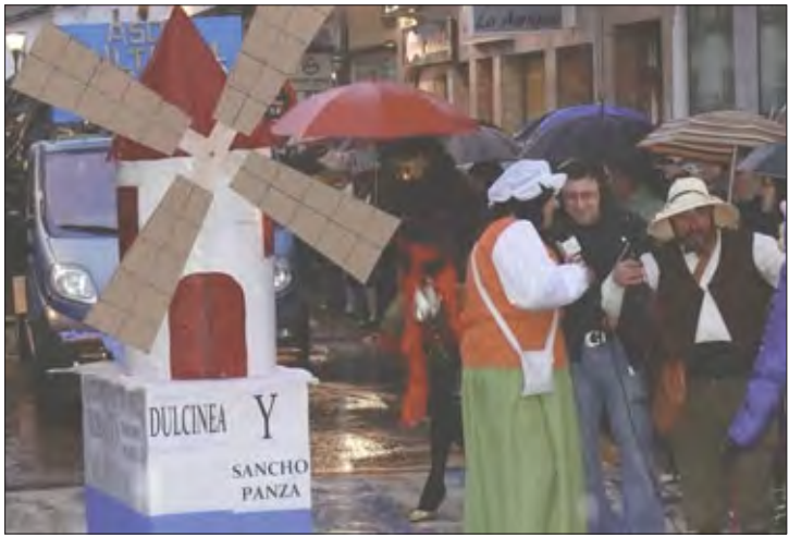
«El Chato y el Rayo»

Arte de Daimiel (Patrocinan Torreón de Fuensanta y Metálicas Sampec) 1200 euros (Patrocina Ocaso y Caja Castilla la Mancha) 2º Los Tunantes de Piedrabuena 1800 euros patrocinado por el Ayuntamiento 1º Los Remaches de Moral de Calatrava 3000 euros Especial Patrocinado por la Conserjería de Industria: La Blanca Doble.