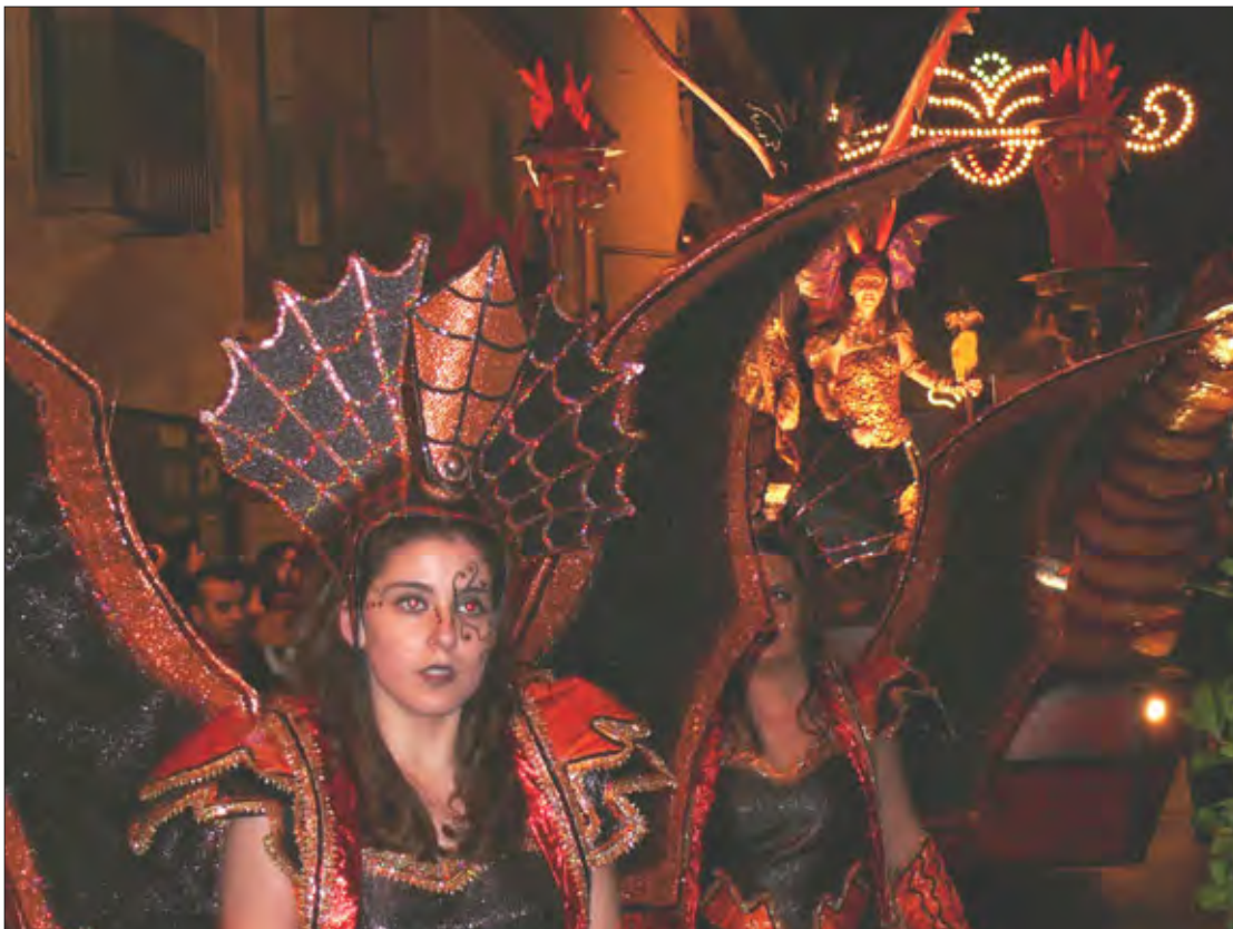
Peña «La Blanca doble» (Almagro): premio especial, dotado con 3.000 euros