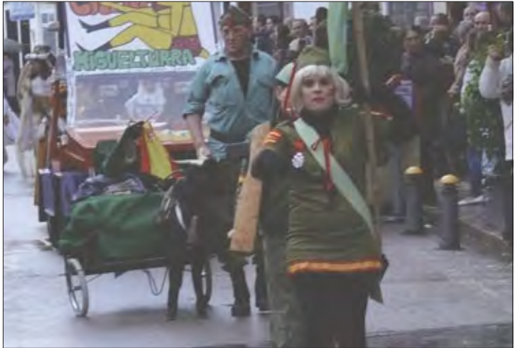
«La legión churriega»