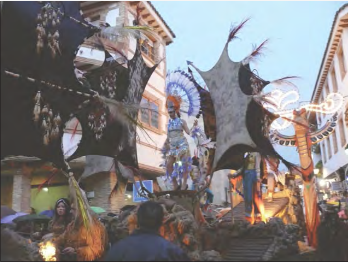
Peña «Los Remaches» (Moral de Cvª.): Primer premio, dotado con 1.800 euros