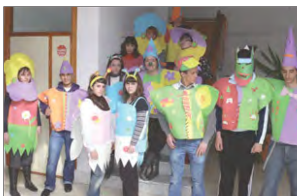
Alumnos del P.C.P.I. (Casa de Cultura)