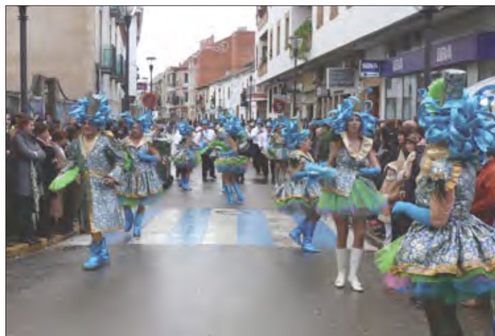
Peña «Los Segadores»

El premio especial, de 3.000 euros, recayó en la peña La Blanca Doble, de Almagro, con '¡Demonios! ya llevamos 25 años' con una alegoría sobre el bien y el mal, vestidos