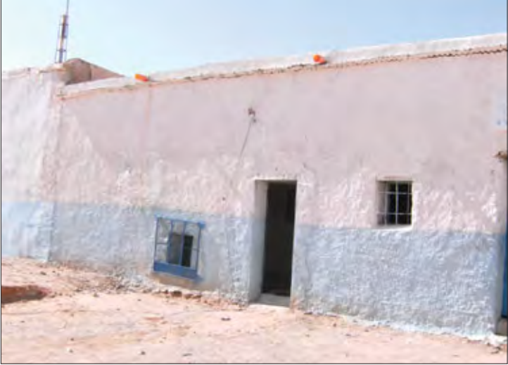
El ayuntamiento destinó 5000 euros al proyecto

En Semana Santa, miembros de la asociación viajarán de nuevo para donar la segunda parte de este proyecto. Por otra parte, la asociación conti-