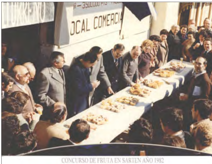
CONCURSO DE FRUTA EN SARTEN AÑO 1982

sión propicia y esperada para la puesta en practica del innovador sistema, de modo que aquellas peñas que estuvieran dispuestas a colaborar, - la decisión era voluntaria, por lo tanto no era cuestión de exigir, sino de agradecer a la que quisiera ayudar - elegirían aquel acto dentro de los que había, que en su opinión, mejor pudieran organizar. Con esa idea se pusieron a trabajar y a colaborar en ese año algunas peñas en tareas organizativas, pues si no hubiera sido por la