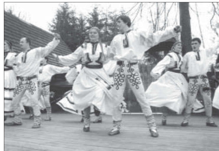
Grupo «Ayfas» de la República Checa

Participarán grupos de la República Checa, Filipinas y el grupo local «Nazarín»