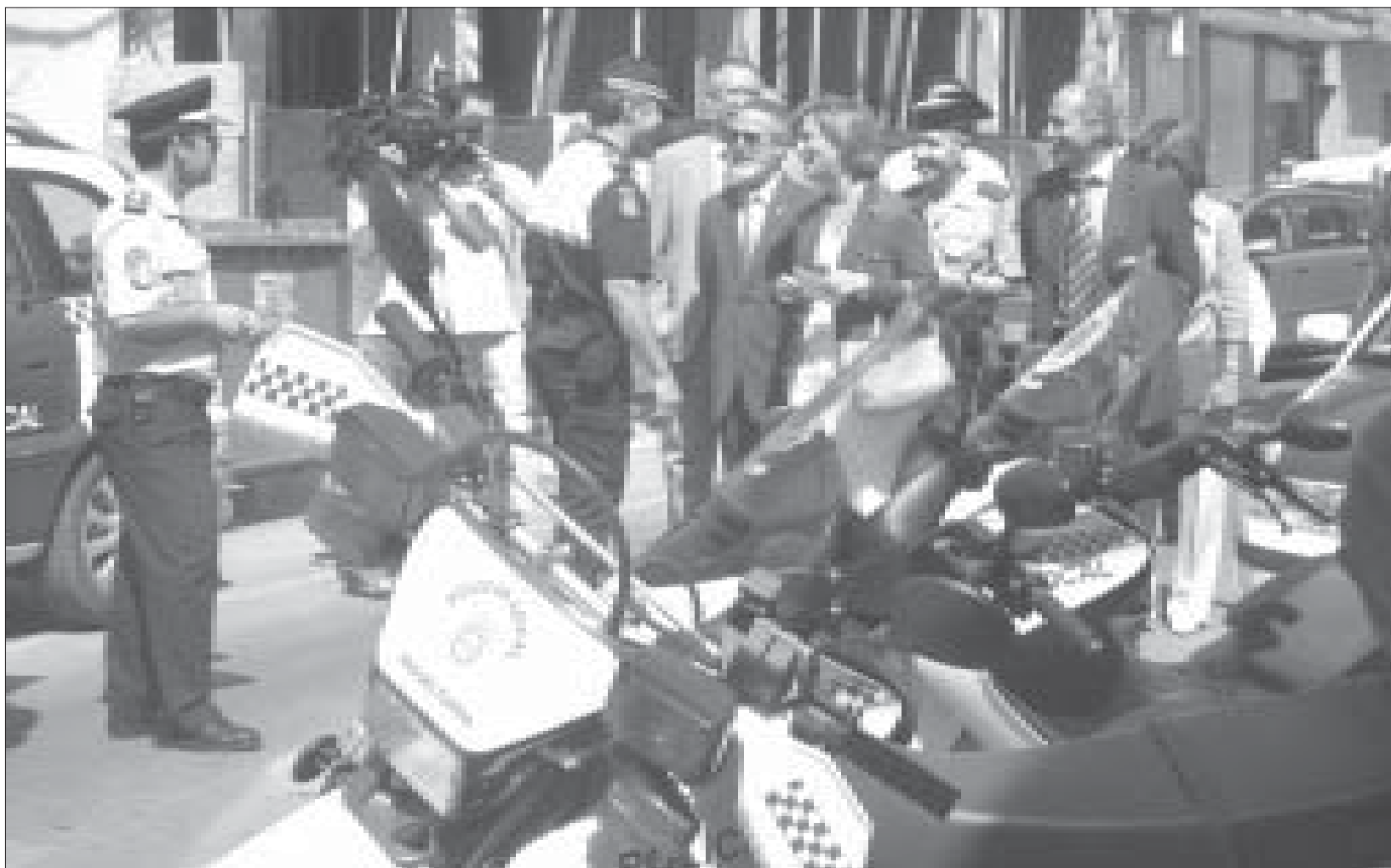
El Subinspector de la Policía Local, Elias Carrión, saluda a las autoridades en su llegada a las nuevas dependencias