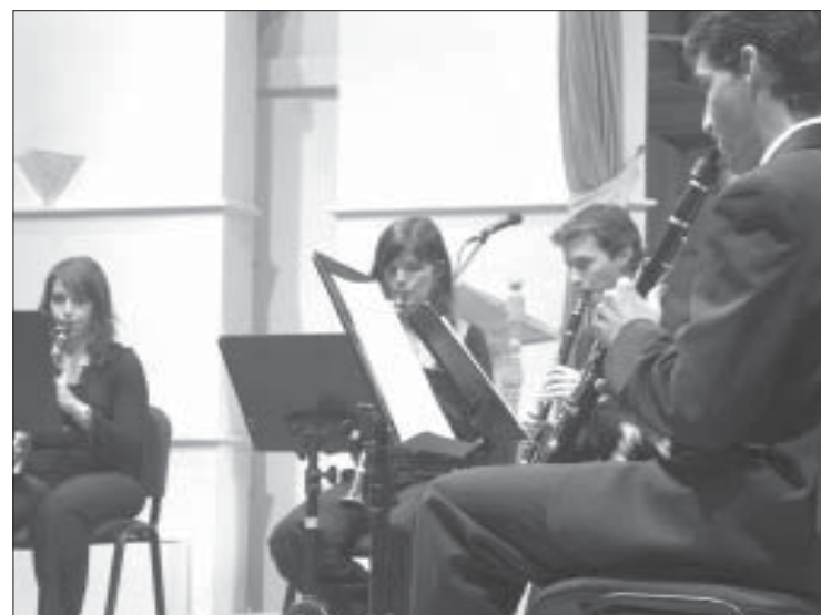
El grupo de clarinetes «Adamus» abrió el acto de entrega