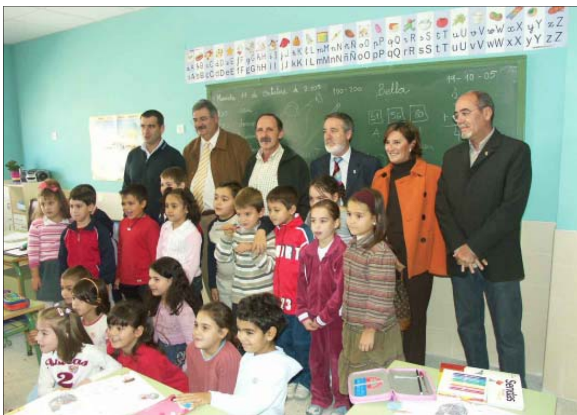
Niños, autoridades y personal del centro en el acto de inauguración

Junto al aulario de primaria ya existente en el centro ubicado en la calle Ancha se ha creado uno nuevo de edu-