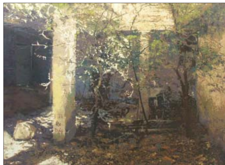
Re Pag, primer premio del certamen de pintura