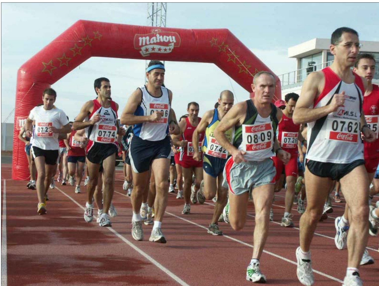
Atletas de clubes de Puertollano, Ciudad Real, Alcázar de San Juan, Almagro, Manzanares, Bailén y Miguelturra tomaron la salida en el Estadio Municipal

Por su parte, el presidente del club organizador, «Fondistas de Miguelturra»,