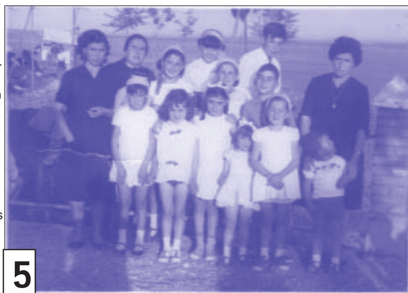
Foto 5: Romería de San Isidro en 1966 (en el depósito del agua). Podemos ver a su abuela, tíos y primos.

Foto 4: Comunion de su tía Desi en 1961. La fotografía está realizada en la plaza de la iglesia.