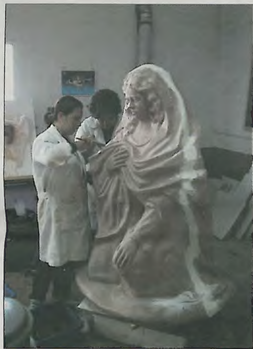
Alumnas trabajando en el moldeado de una figura.

Era esta una apuesta importante del Consistorio Local que en breve quedará resuelta y consolidada.