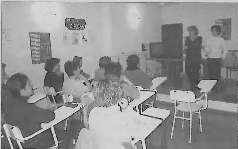
La Concejala de Consumo y la encargada de la OMIC abrieron el curso.

Los interesados pueden dirigirse al propio Centro Social a fin de crear distintos grupos de trabajo.