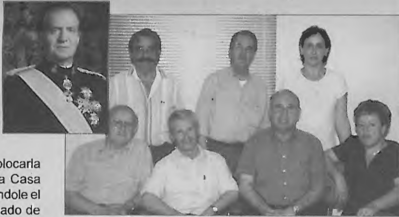
La Junta Directiva al completo, junto a la imagen del Rey

Pero sus inquietudes no quedan ahí. Recientemente han tenido una singular iniciativa y se han dirigido al propio Rey para pedirles una foto y colocarla en su oficina. Amablemente la Casa Real les ha respondido, remitiéndole el retrato Real, lo que les ha llenado de satisfacción y sano orgullo.