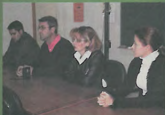
Momento de la inauguración del curso

Durante este mes se podrán solicitar las plazas que queden vacantes.