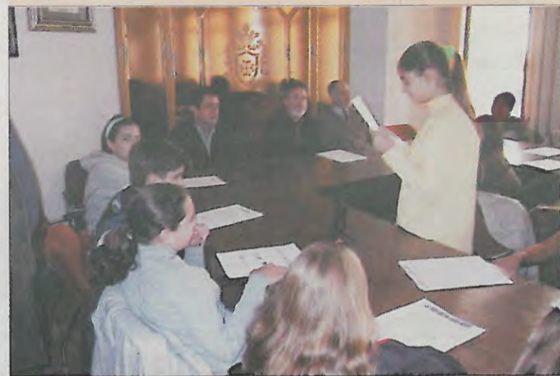
Los niños del CP Santísimo Cristo en el Ayuntamiento

comentó el funcionamiento del Consistorio, así como las obras que se están realizando en la localidad, haciendo hincapié en las que resultaban más cercanas a los niños, como parques, áreas