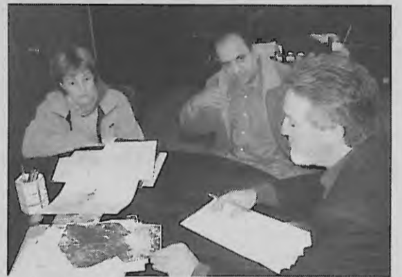
Miembros de la directiva con el alcalde

Los miembros que componen la Asociación han comenzado, de esta forma, a autogestionar su proyecto, tras haber contado en sus primeros pasos con el Servicio de Orientación Municipal. Entre sus proyectos más inminentes y concretos está el proponer al Consistorio Local que exista un representante de la Asociación en la gestión