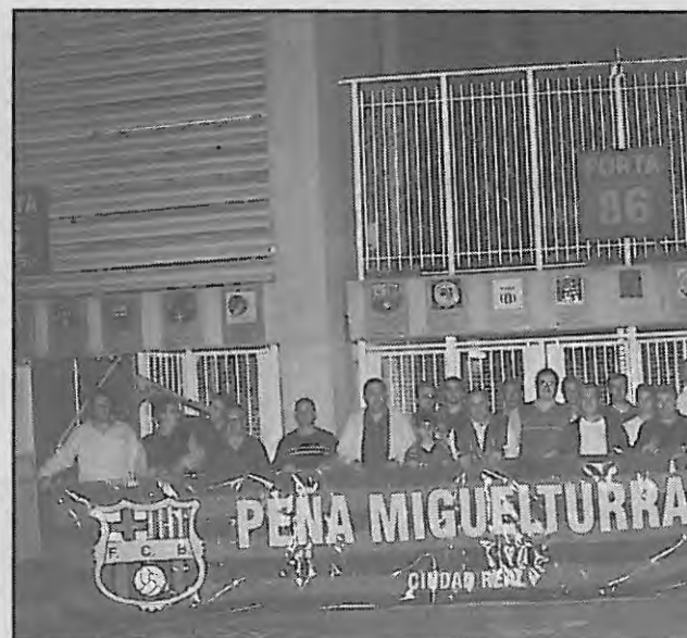
Integrantes de la expedición sujetando la pancarta de la Peña.

el domingo do en torn che, en lo c gún inciden dos que di estancia e aquí, tamb que la pe