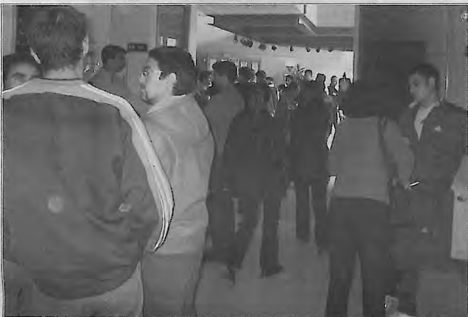
Alumnos del curso durante uno de los descansos

Las VI Jornadas de Medicina Deportiva de Castilla La Mancha, que organiza el Club Baloncesto Alucal, en colaboración con la Junta de Comunidades, Diputación Provincial y Ayuntamiento de Miguelturra, se han venido desarrollando durante los dos primeros fines de semana de mayo, tanto en el Casa de la cultura como en el Pabellón Municipal cubierto.