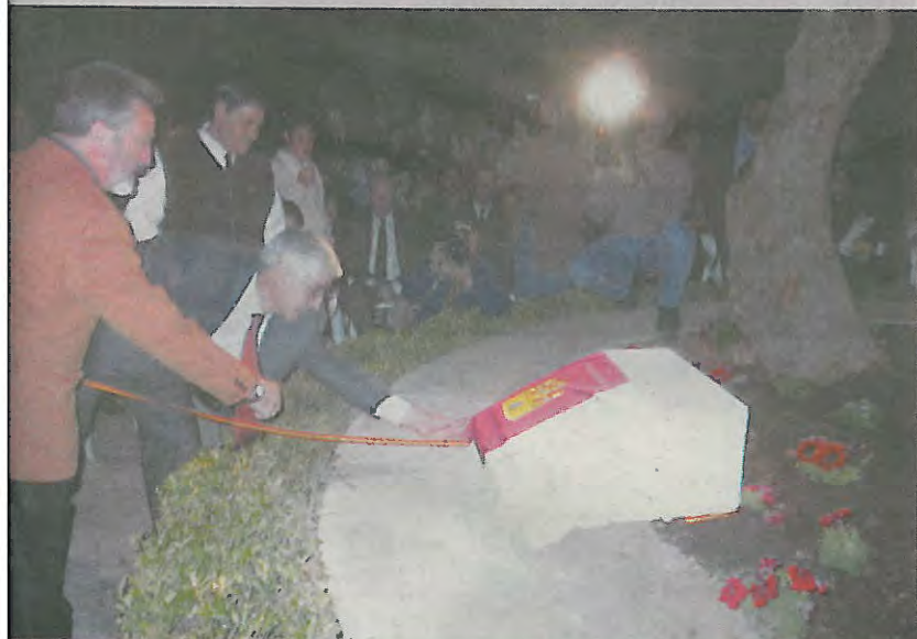
El Vicepresidente regional descubre la placa conmemorativa