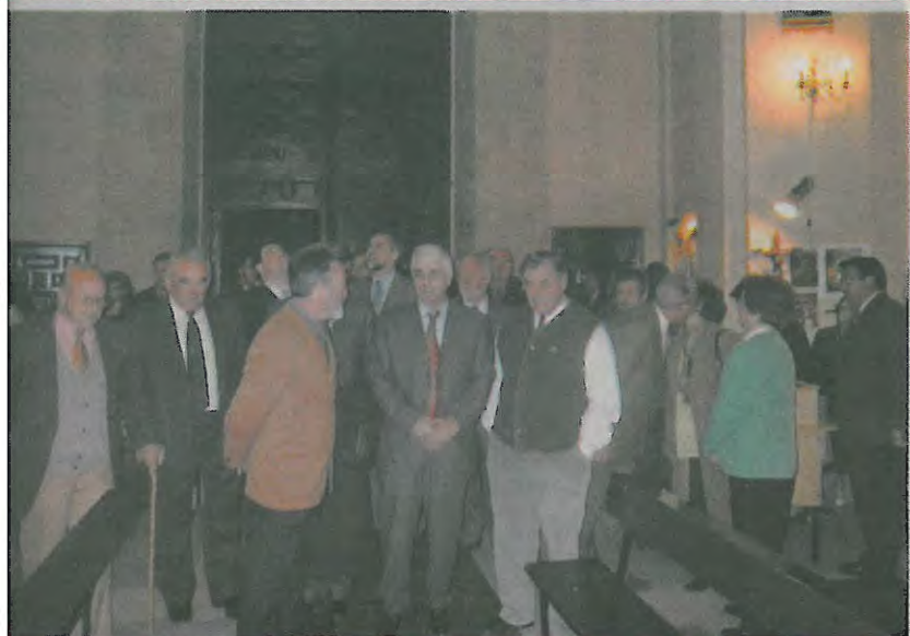
Las autoridades contemplaron el resultado final de todas las obras de mejora, entre ellas el cambio del solado del templo.