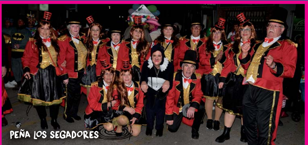
PEÑA LOS SEGADORES