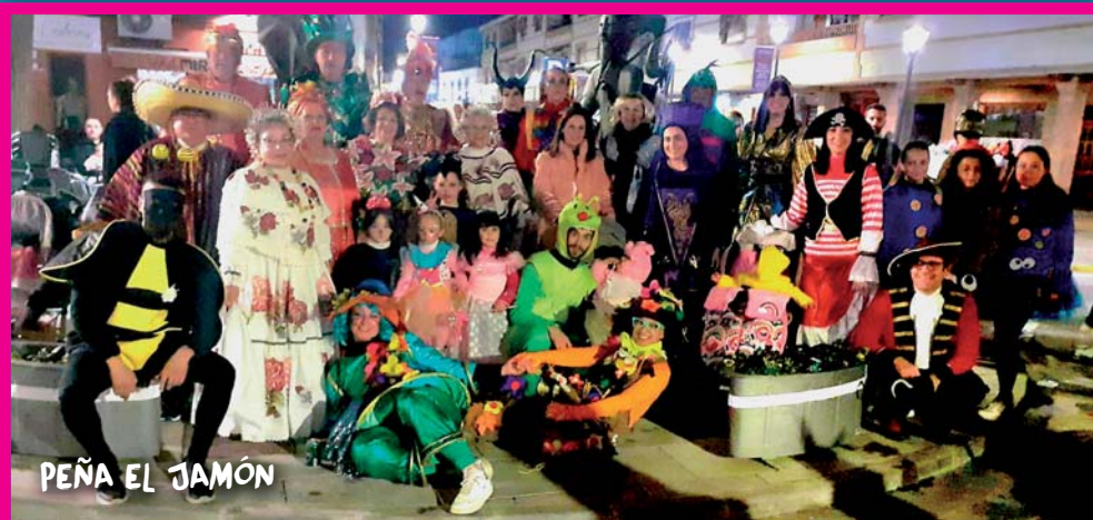
PEÑA EL JAMÓN