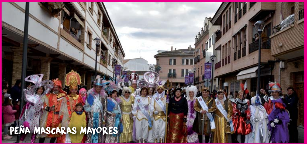
PEÑA MASCARAS MAYORES