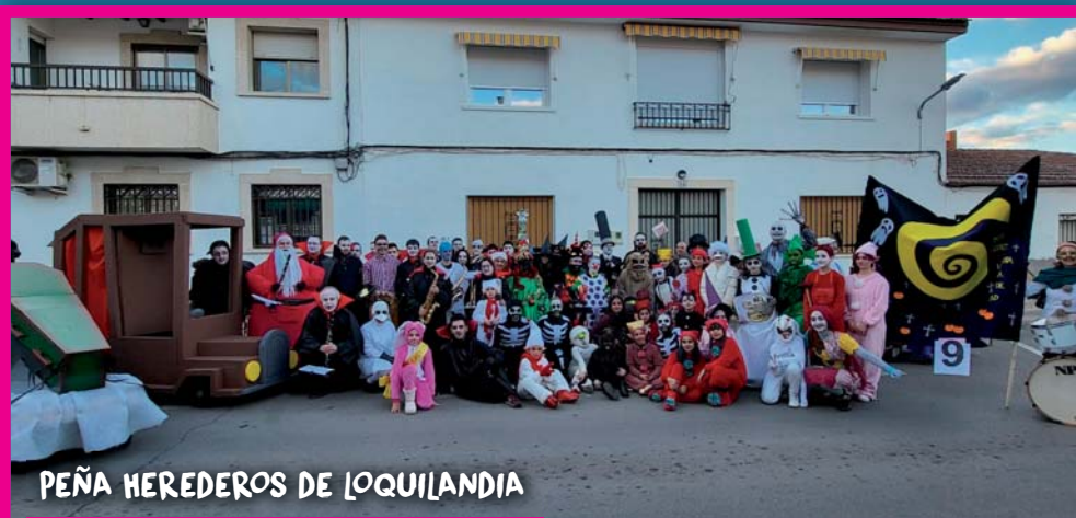
PEÑA HEREDEROS DE LOQUILANDIA