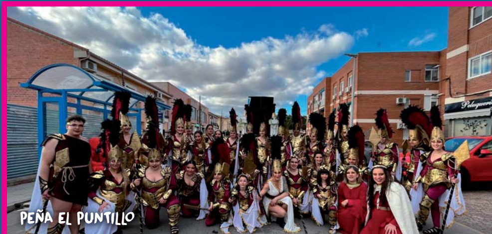
PEÑA EL PUNTILLO