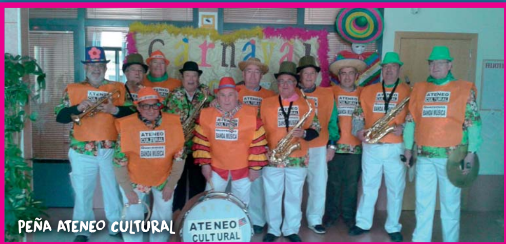
PEÑA ATENEO CULTURAL