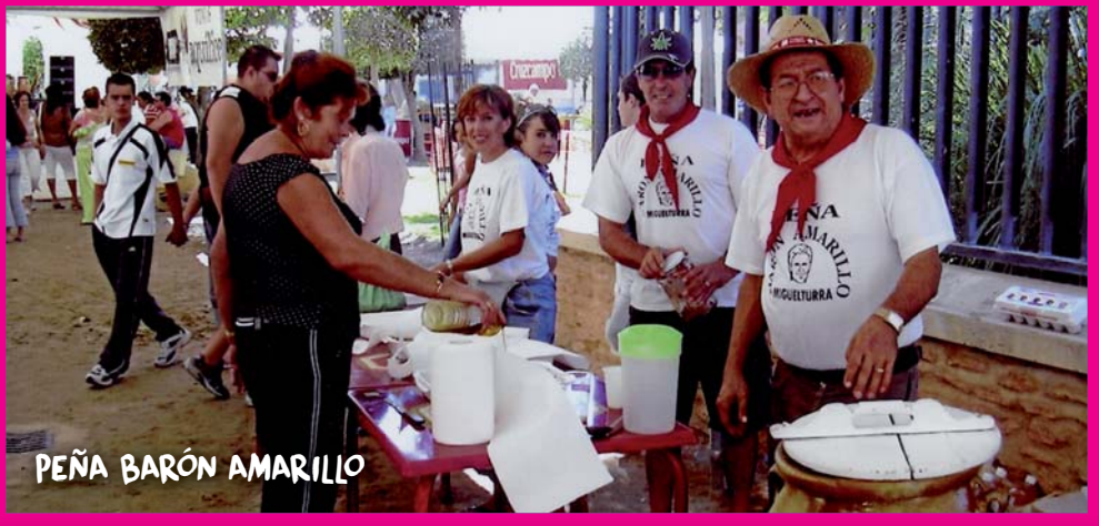
PEÑA BARÓN AMARILLO