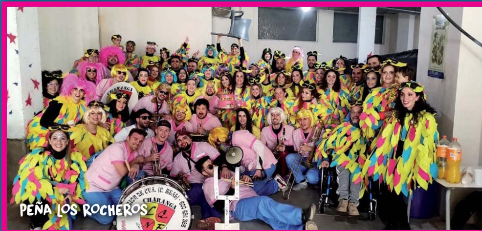
PEÑA LOS ROCHEROS