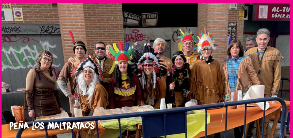
PEÑA LOS MALTRATAOS