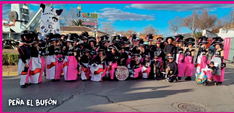
PEÑA EL BUFÓN