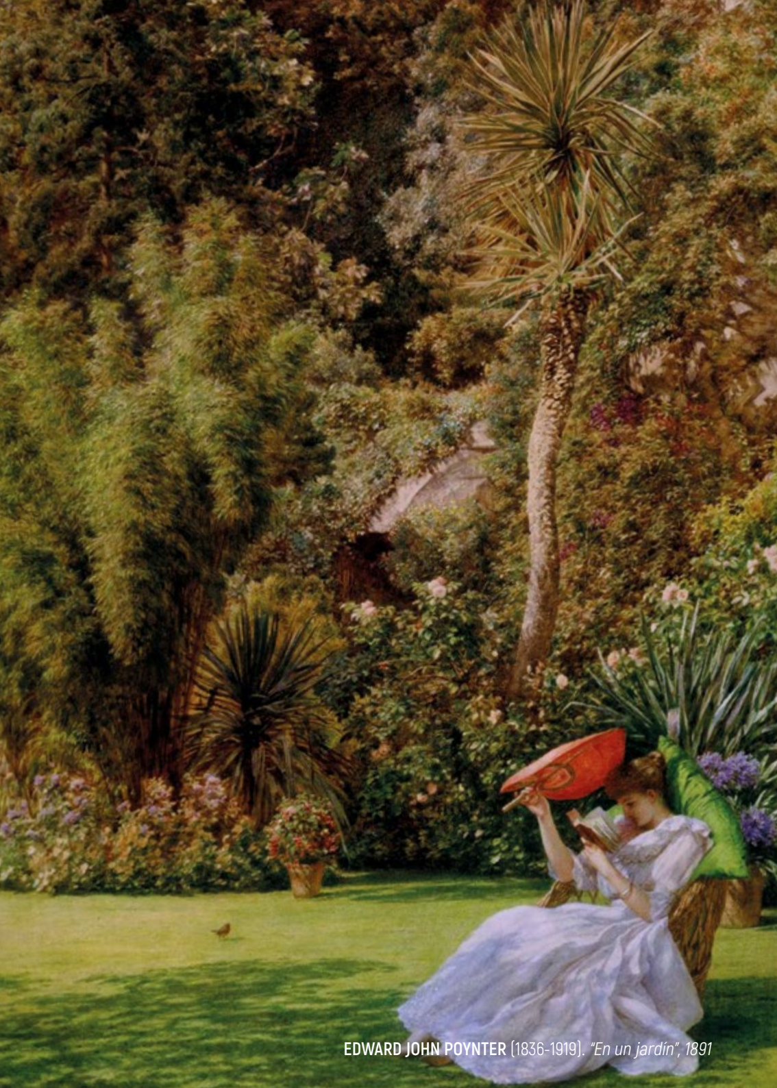
EDWARD JOHN POYNTER (1836-1919). "En un jardín", 1891