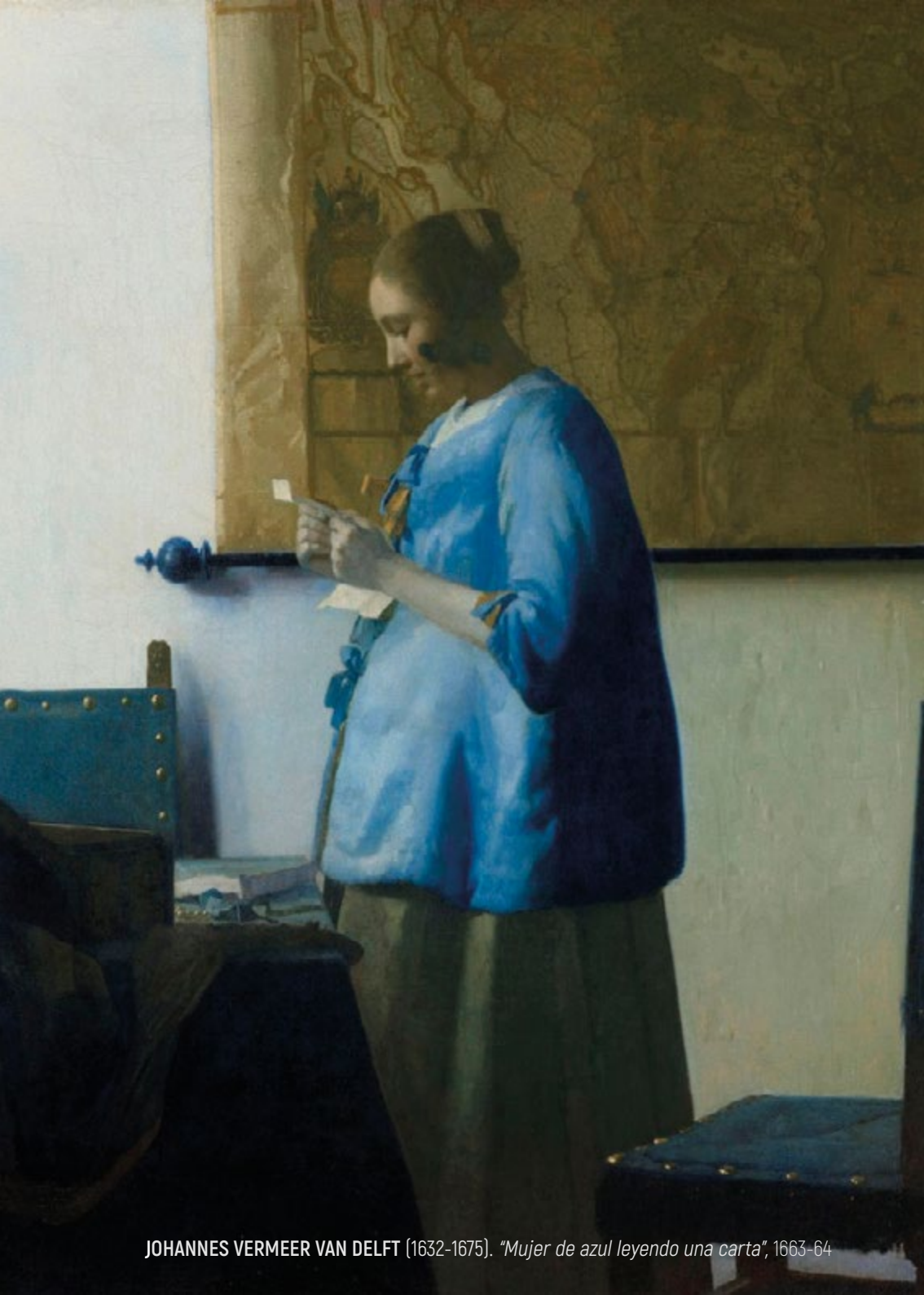
JOHANNES VERMEER VAN DELFT (1632-1675). "Mujer de azul leyendo una carta", 1663-64