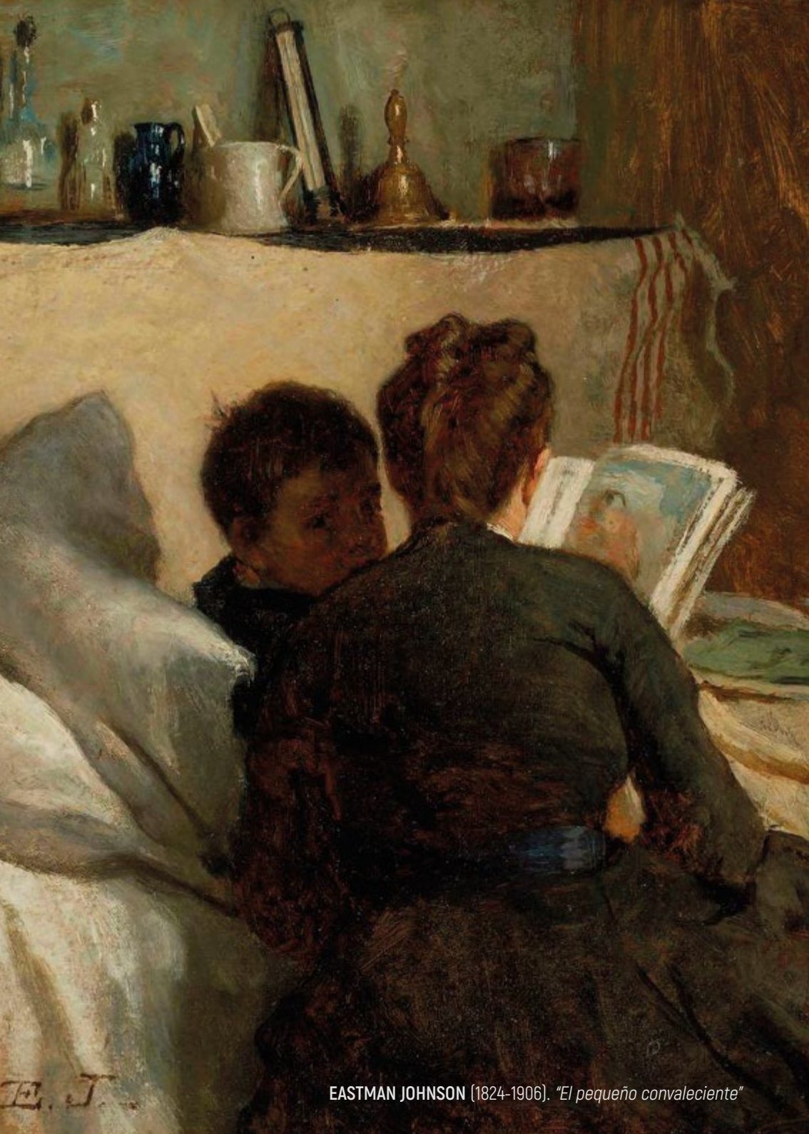
EASTMAN JOHNSON (1824-1906). "El pequeño convaleciente"