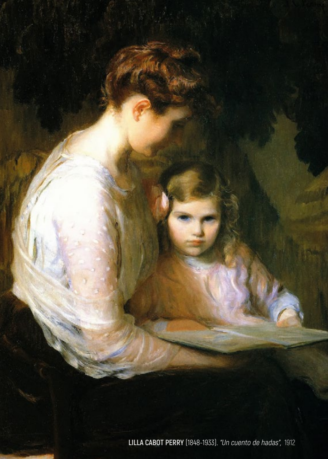
LILLA CABOT PERRY (1848-1933). "Un cuento de hadas", 1912