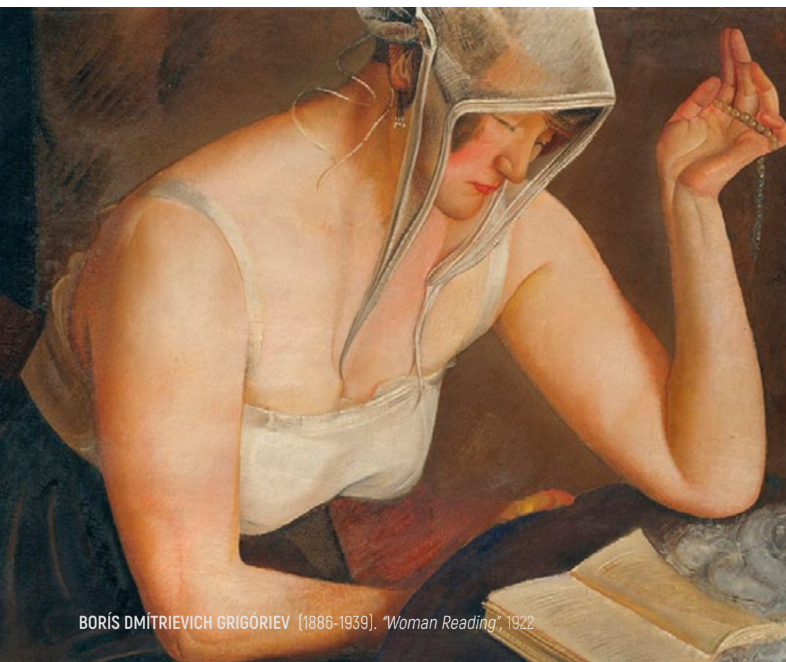
BORÍS DMÍTRIEVICH GRIGÓRIEV [1886-1939]. "Woman Reading", 1922

De entre las pintoras y pintores cuyas obras forman parte de esta muestra, podemos citar a Marie Bashkirtseff, Renoir, Berthe Morisot, Fragonard, Mary Cassatt, o Manet, grandes artistas que con estas pinturas han contribuido indirectamente al objetivo fundamental perseguido en este proyecto, la igualdad.