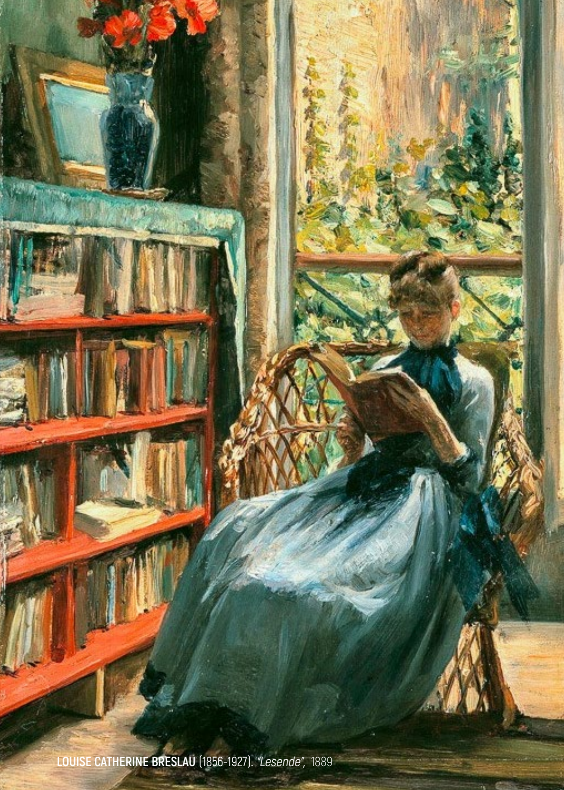
LOUISE CATHERINE BRESLAU (1856-1927). "Lesende", 1889