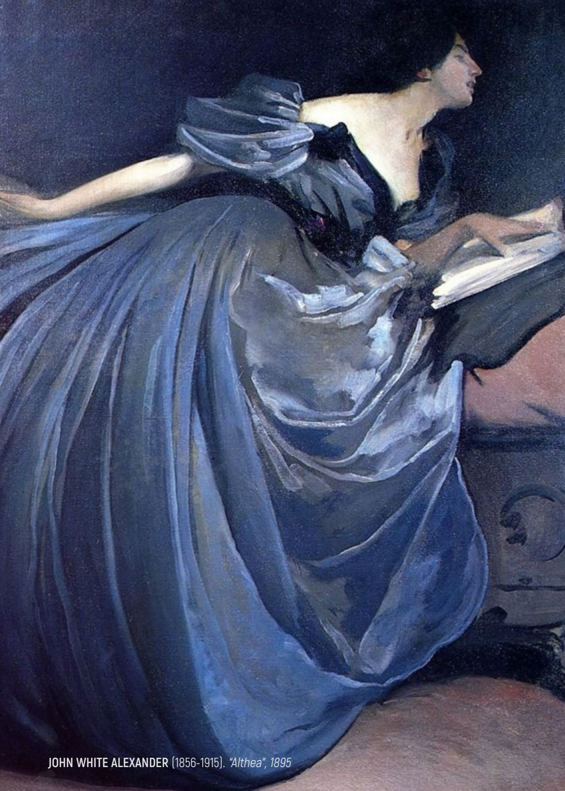
JOHN WHITE ALEXANDER (1856-1915). "Althea", 1895