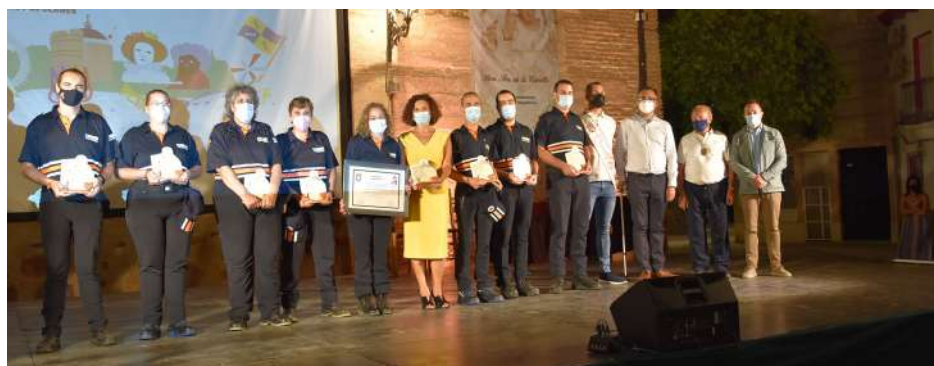
Inauguración de las fiestas