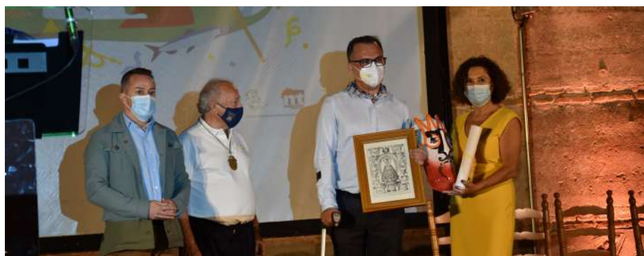
Pregón de las fiestas