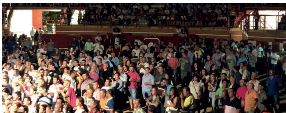
Público en el auditorio