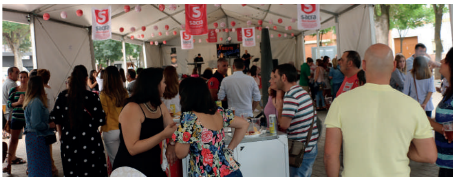
Bailes de la Jarrilla