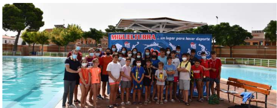
Campeonato de natación