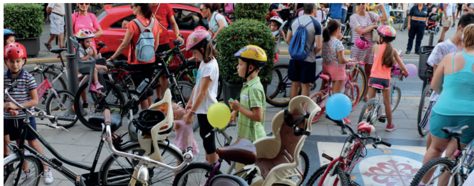
Día de la bici