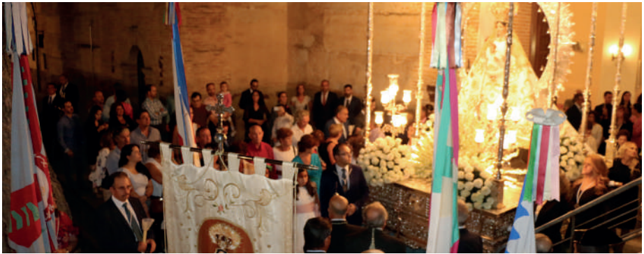
Procesión de la Virgen de la Estrella