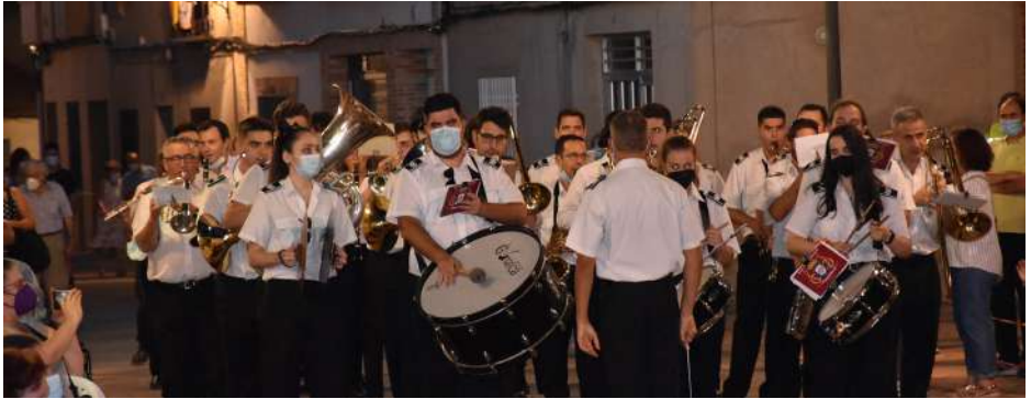
Banda de música