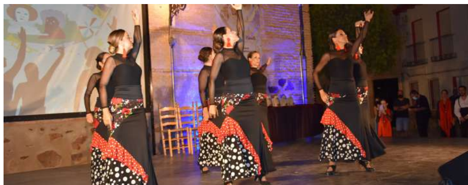
Actuación de Taconarte