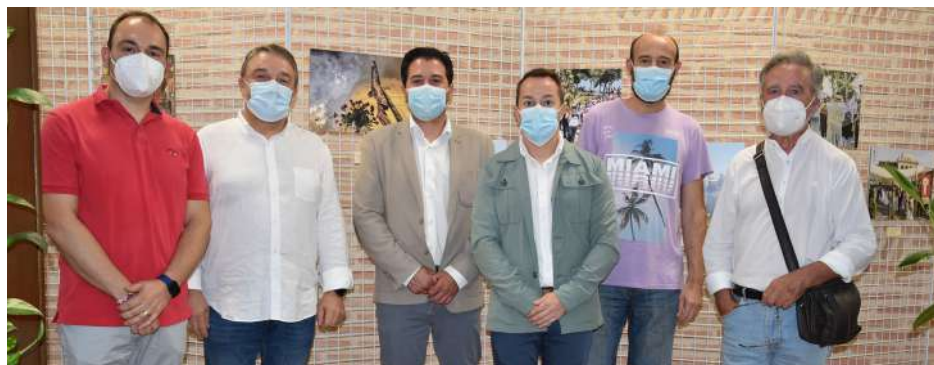
Exposición Objetivo Miguelturra