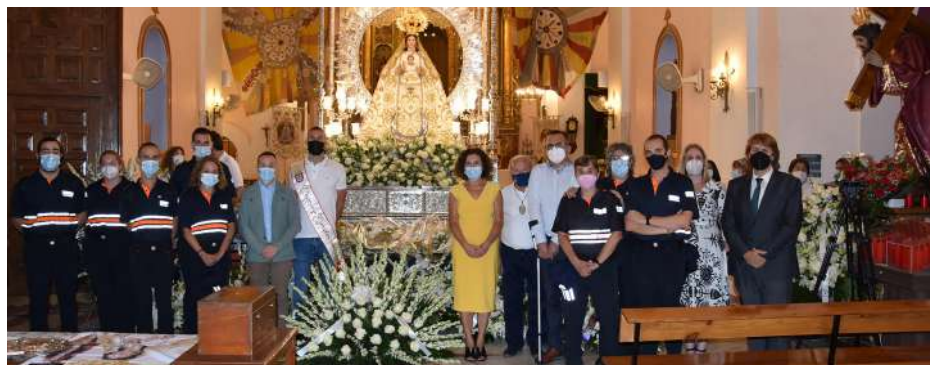
Ofrenda a la Virgen de la Estrella