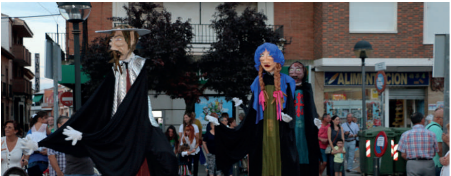
Gigantes y cabezudos